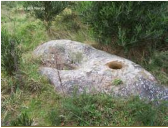
Carne d'Ung. Nancys