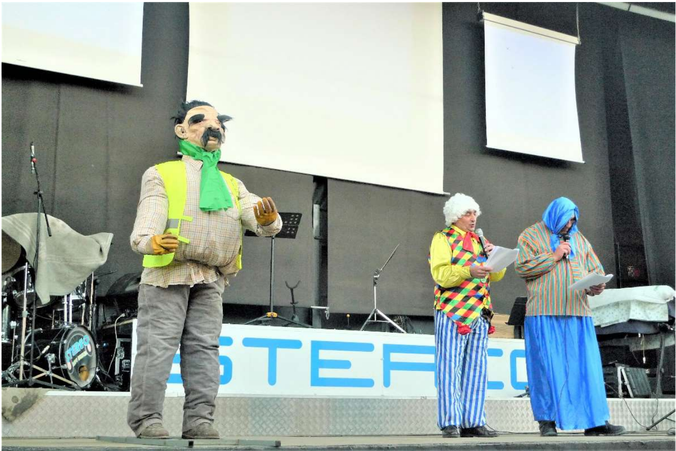
FOTO Nº 15. OS DOUS PREDICADORES E O ENTROIDO. 2012.