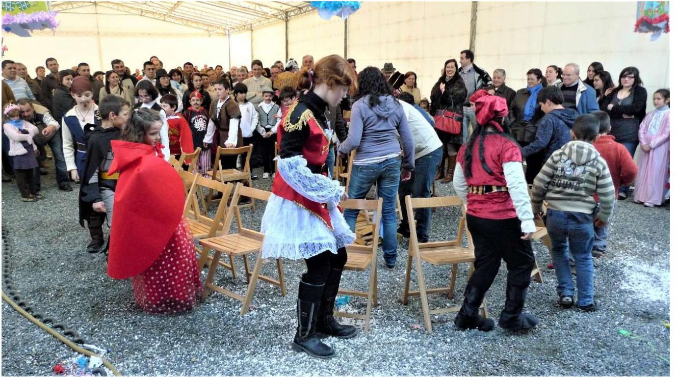
FOTO Nº 19. XOGO DAS CADEIRAS. 2011.