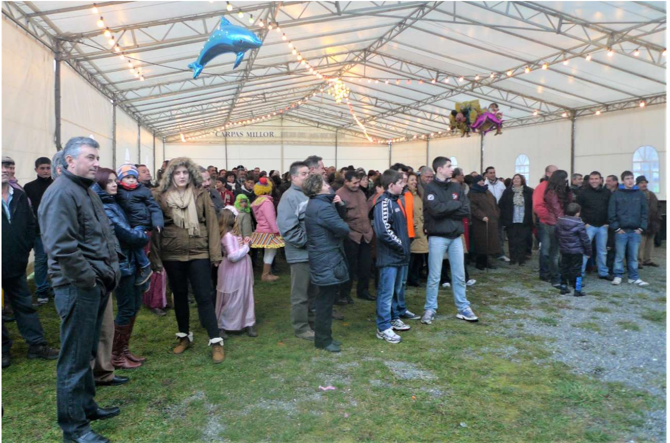
FOTO Nº 14. PÚBLICO ASISTENTE AO EVENTO. 2009.