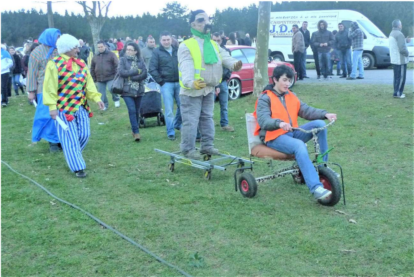
FOTO Nº 13. CHEGADA DO ENTROIDO E DOS PREDICADORES. 2012.