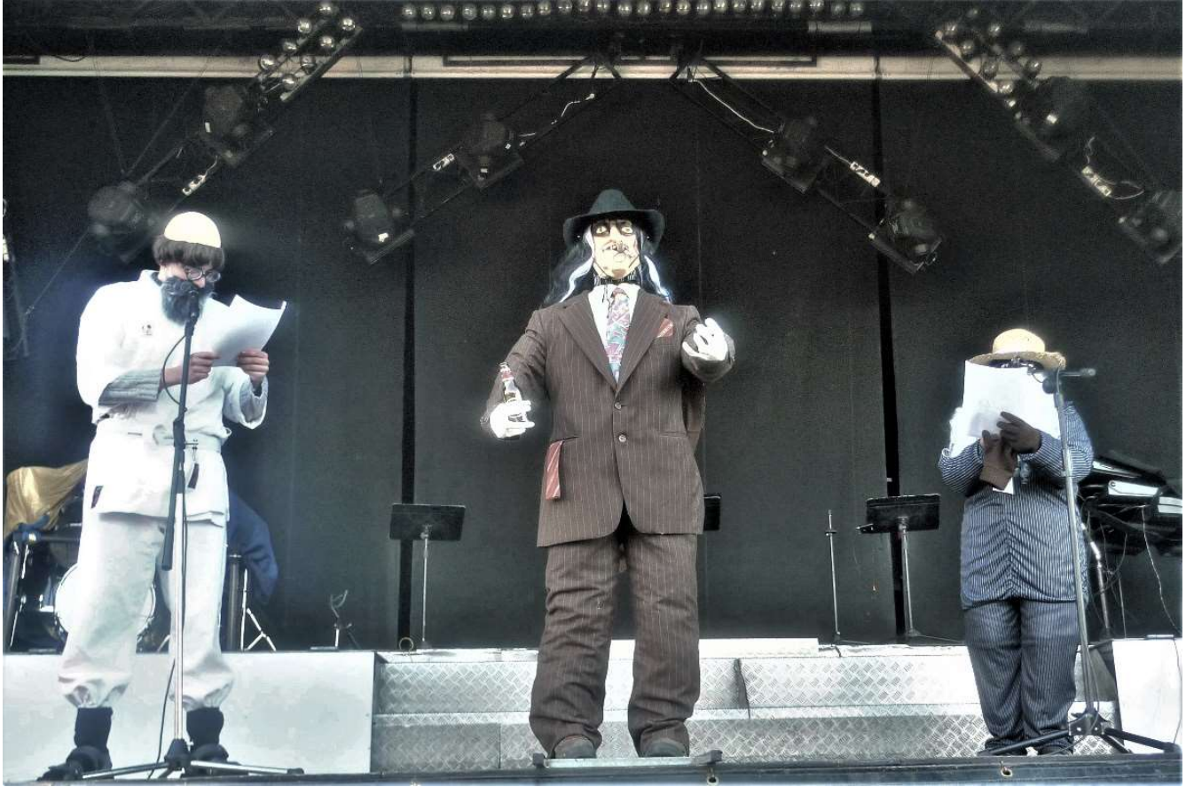
FOTO Nº 3. OS DOUS PREDICADORES E O ENTROIDO NO CENTRO. ANO 2010