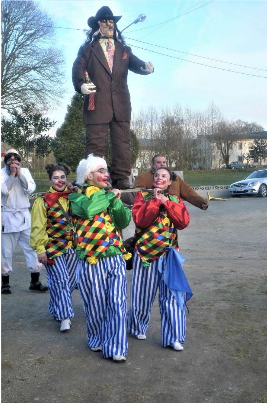
FOTO Nº 5. OS ORGANIZADORES LEVAN NAS ANDAS AO ENTROIDO.