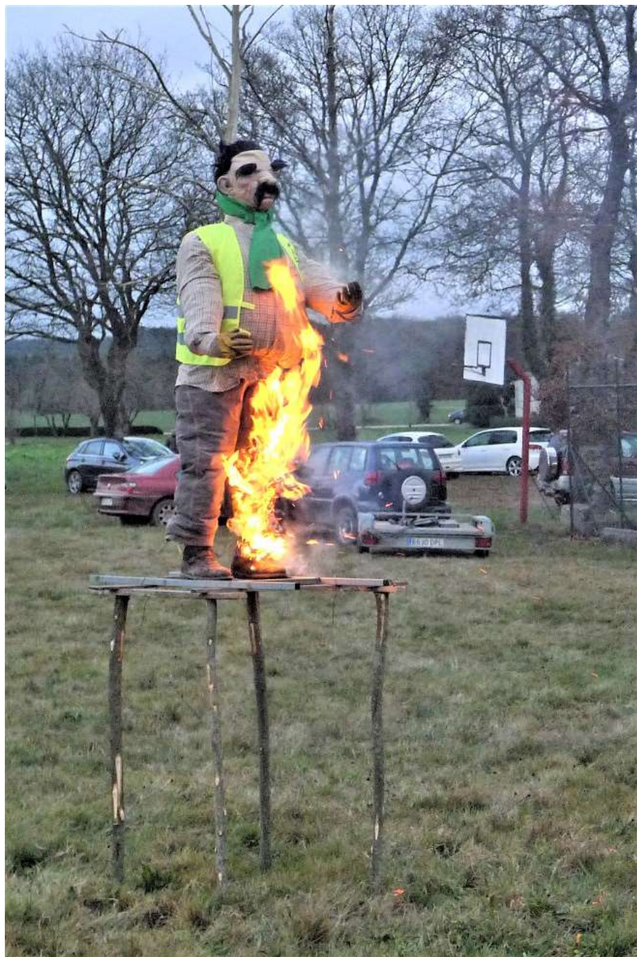
FOTO Nº 16. A QUEIMA DO ENTROIDO.