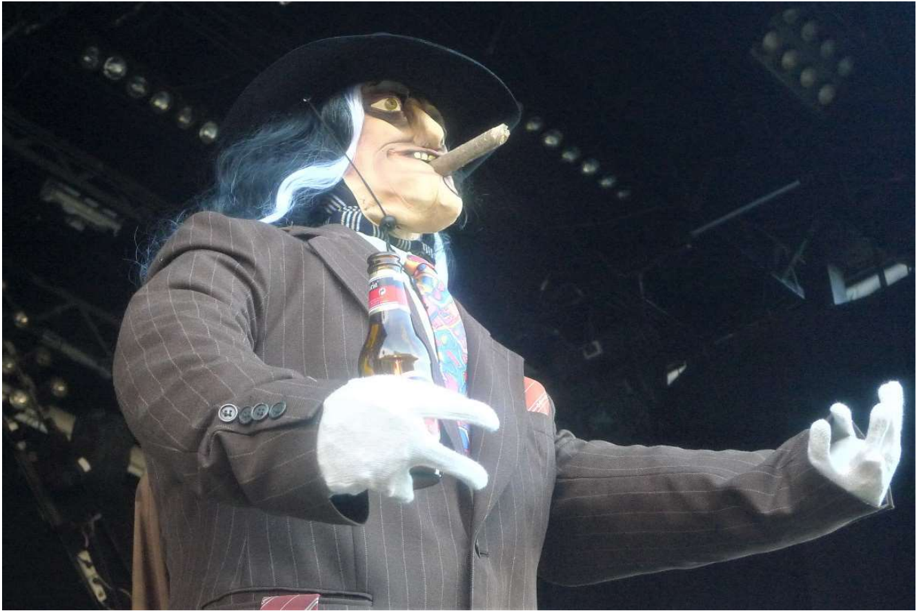
FOTO Nº 4. DETALLE DO ENTROIDO.