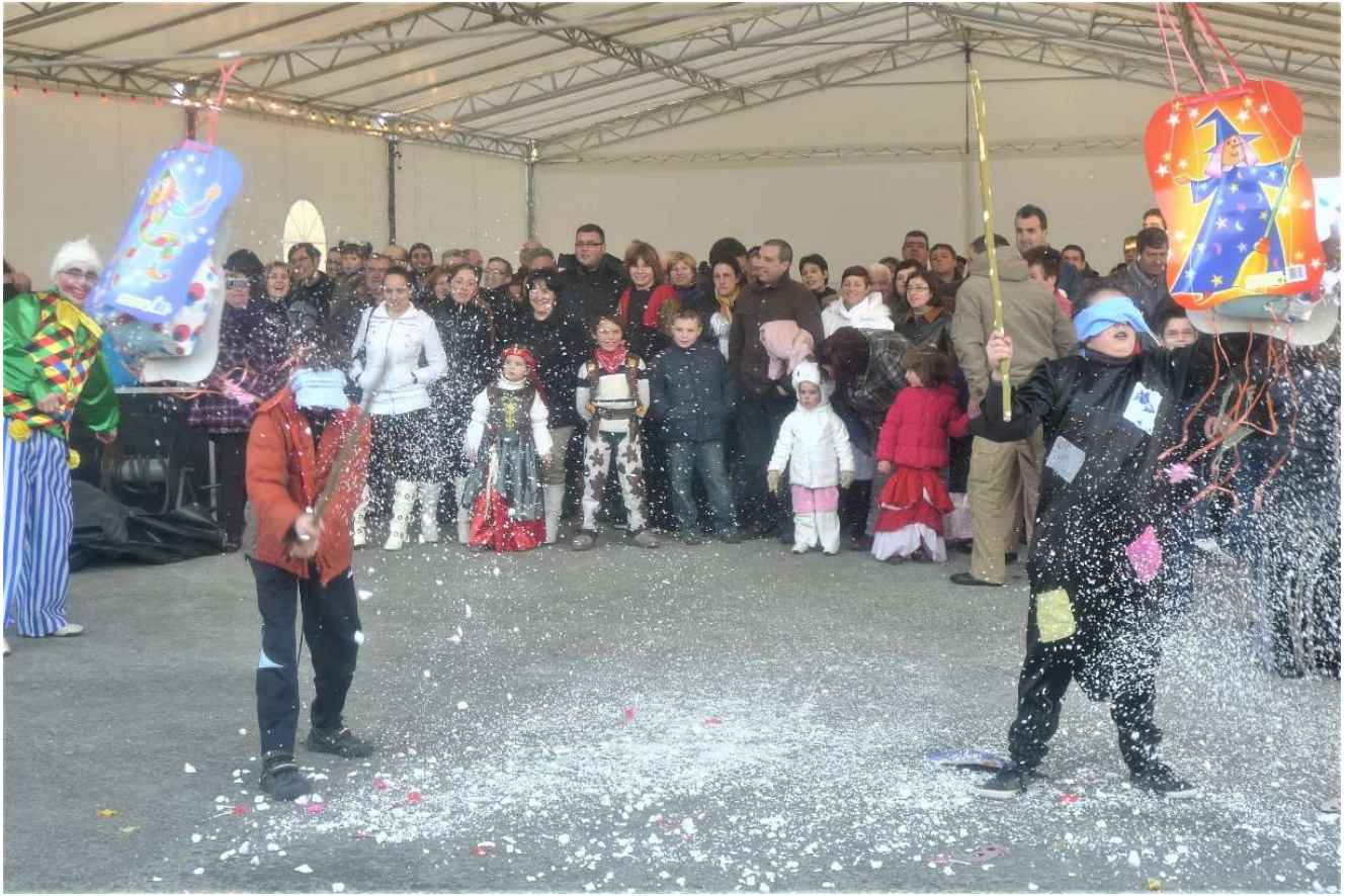
FOTO Nº 2. XOGO DOS PUCHEIROS. 2009