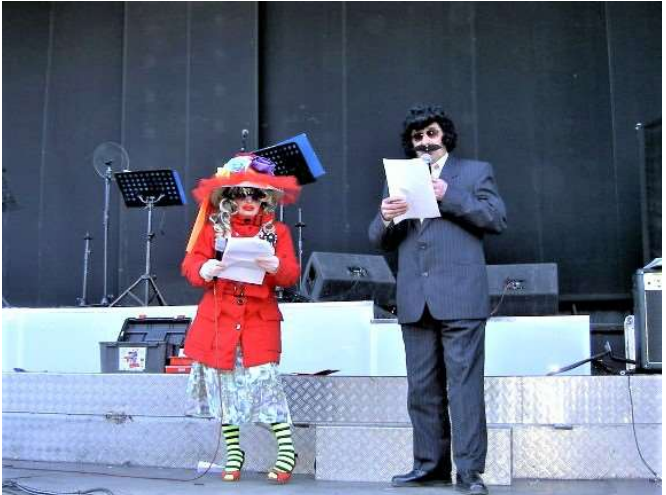
FOTO Nº 10. OS DOUS PREDICADORES. ANO 2011.