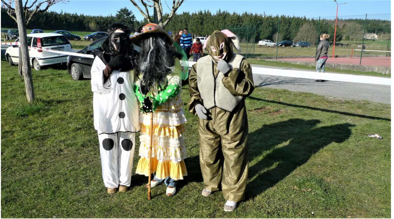
FOTO Nº 7. GRUPO DE MÁSCARAS. 2011.