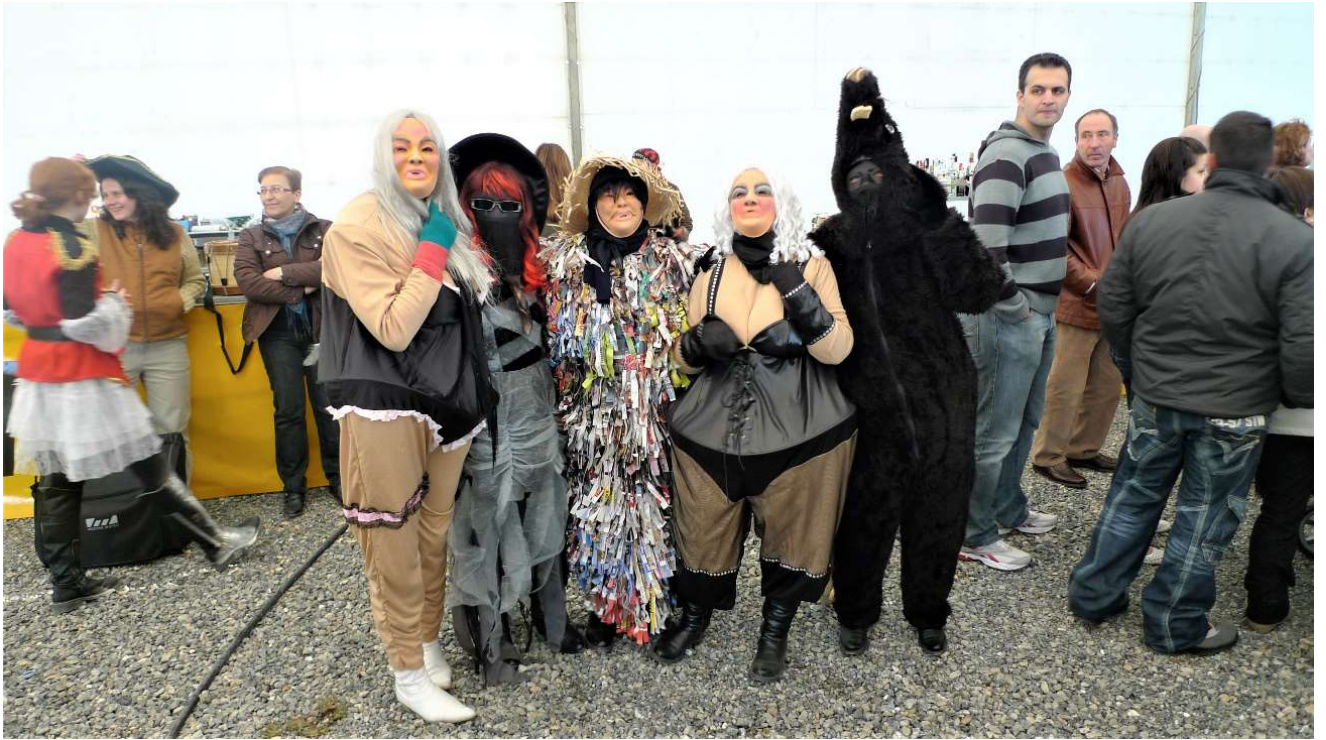
FOTO Nº 17. GRUPO DE MÁSCARAS. 2011.