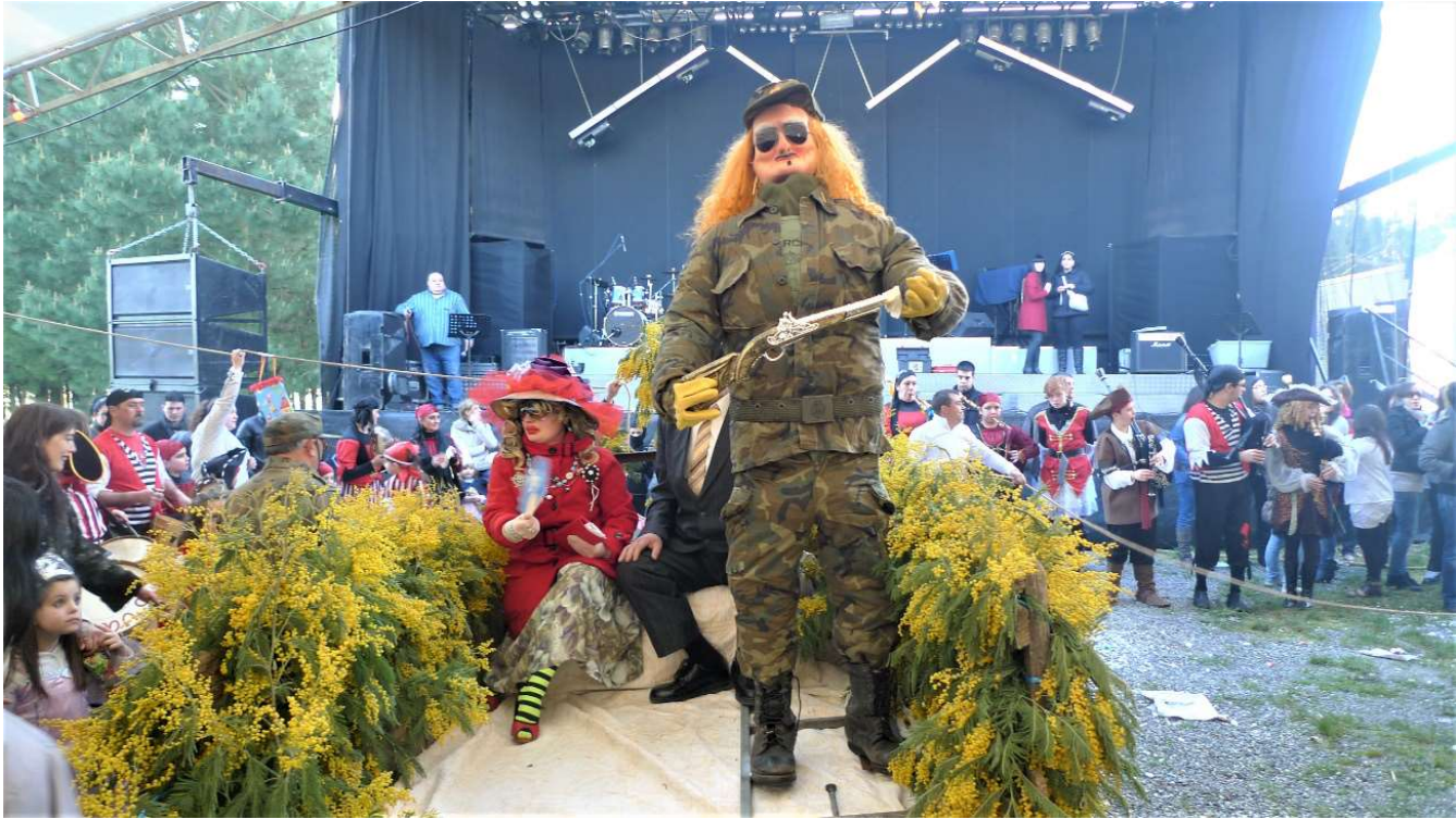
FOTO Nº 9. CHEGADA DO ENTROIDO E OS DOUS PREDICADORES.2011