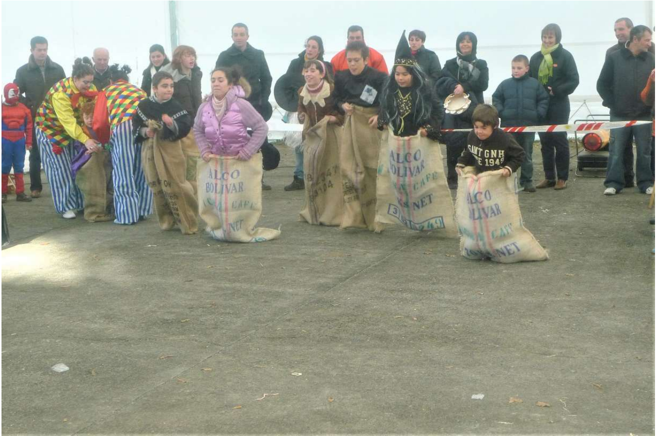
FOTO Nº 8. XOGO POPULAR. CARREIRA DE SACOS. 2009.