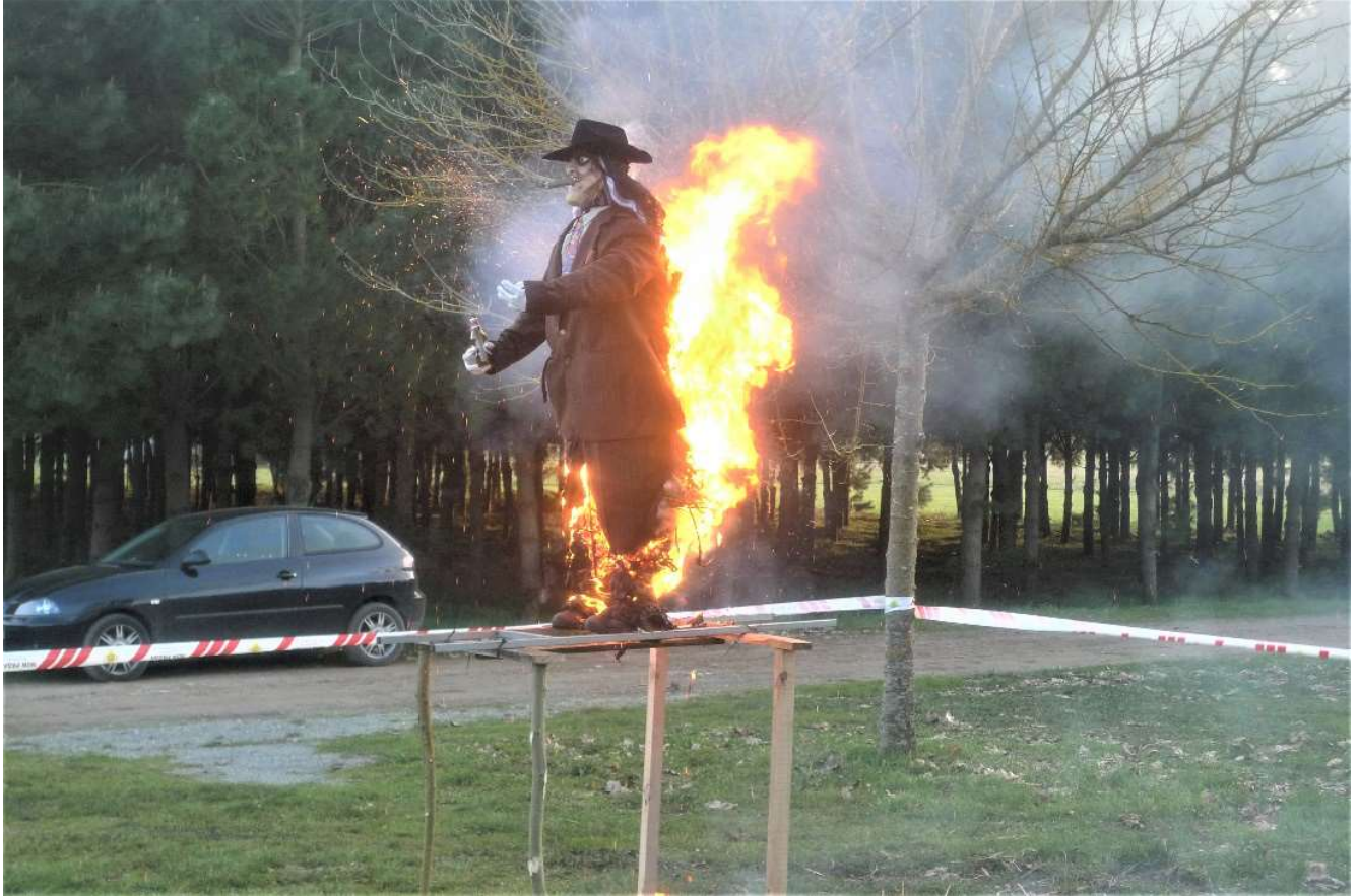
FOTO Nº 6. A QUEIMA DO ENTROIDO. ANO 2010.