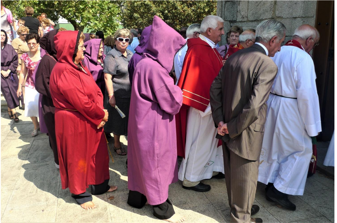
DEVOTAS NA PROCESIÓN, DESCALZAS E CO HÁBITO