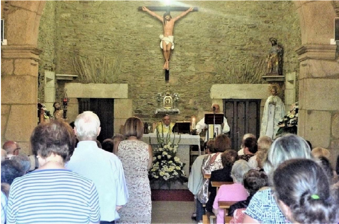
FOTO Nº5. A MISA SOLEMNE O DÍA DA FESTIVIDADE DO ECCE HOMO