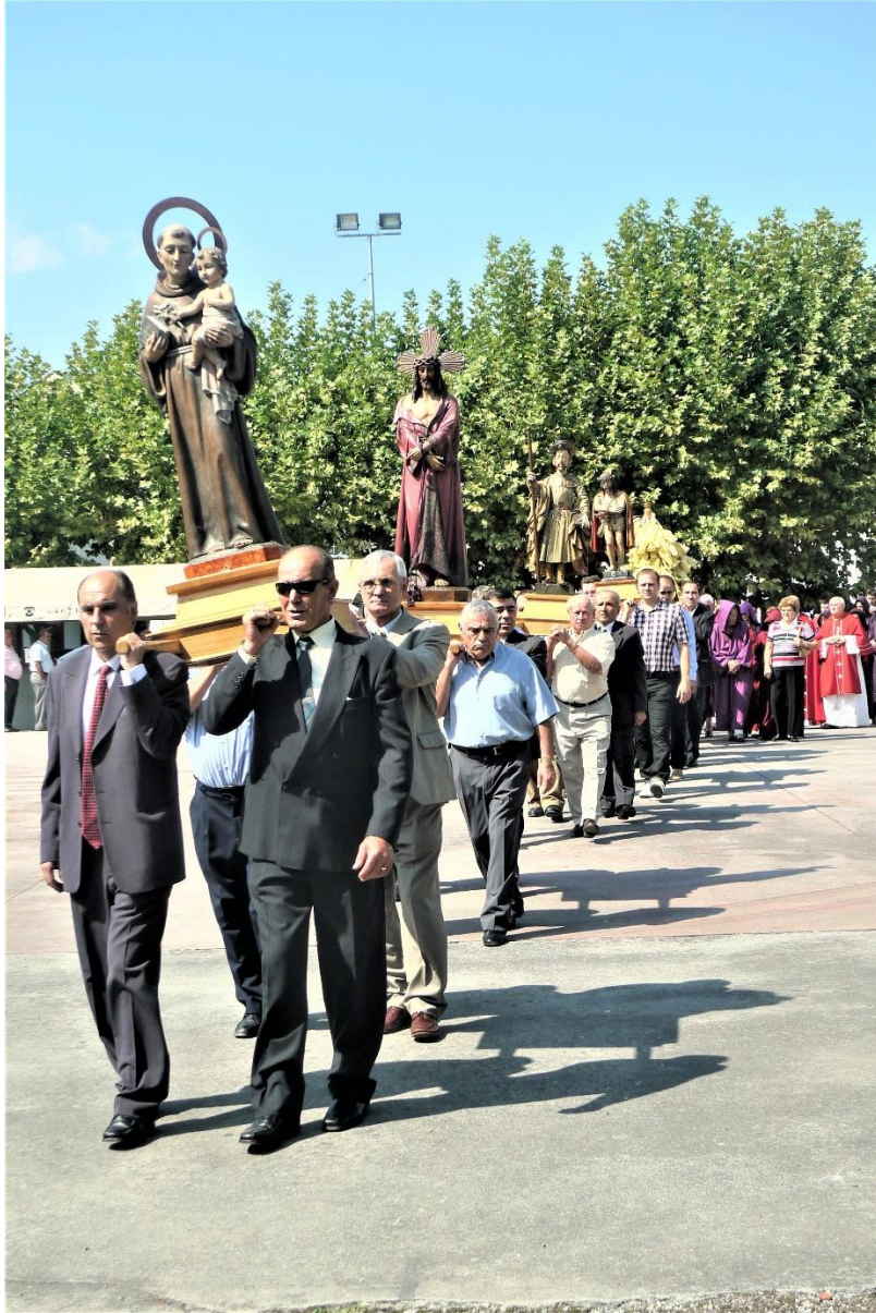
DETALLE DA PROCESIÓN