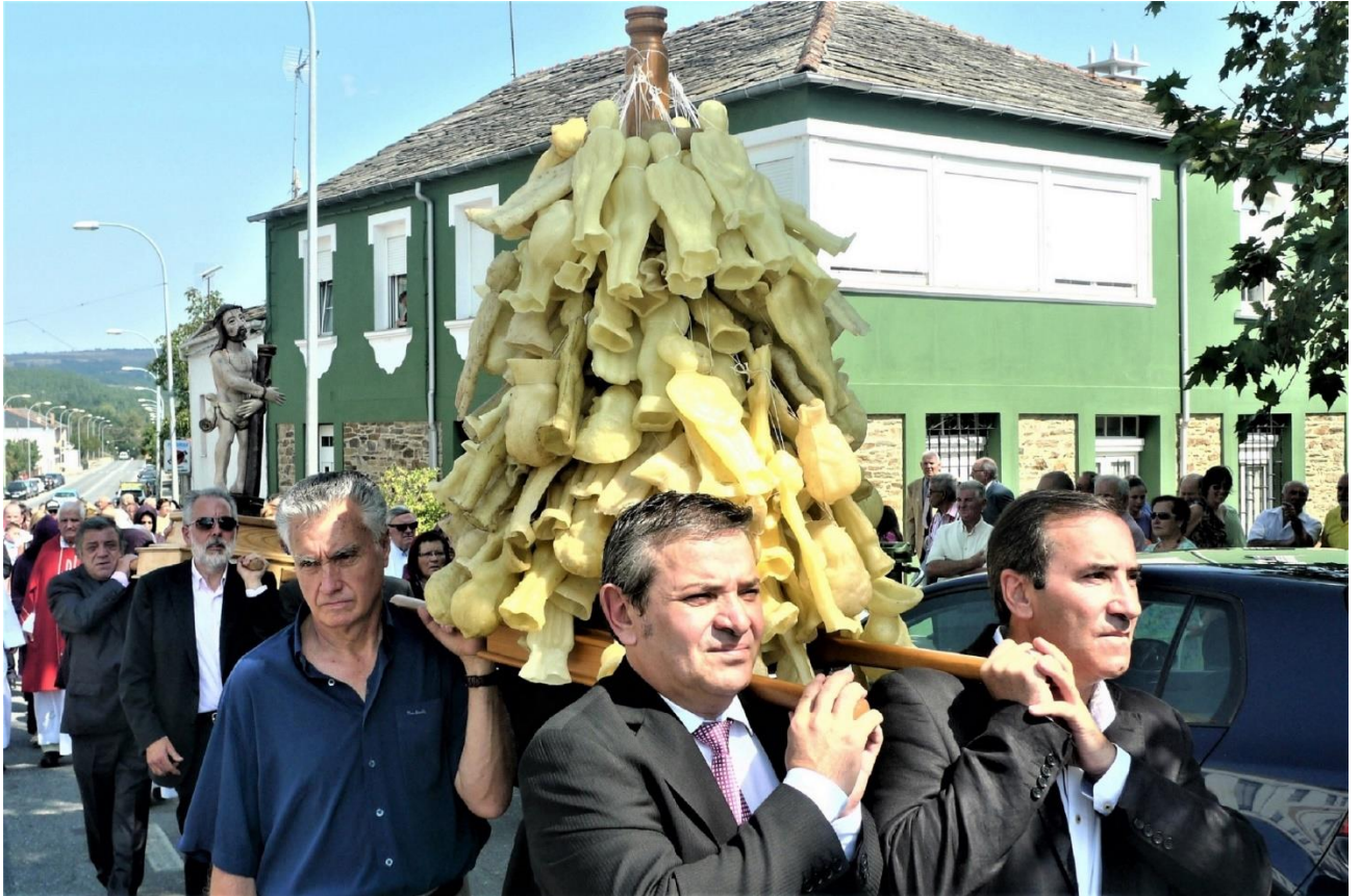
DEVOTOS LEVANDO NAS ANDAS “ FIGURAS DE CERA” REPRESENTANDO DIVERSAS PARTES DO CORPO HUMANO. OFRENDA IMPORTANTE NO “ECCE HOMO” DE RUBIÁN.