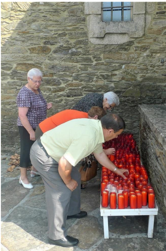
FOTO Nº8. DEVOTOS OFRECENDO VELÓNS