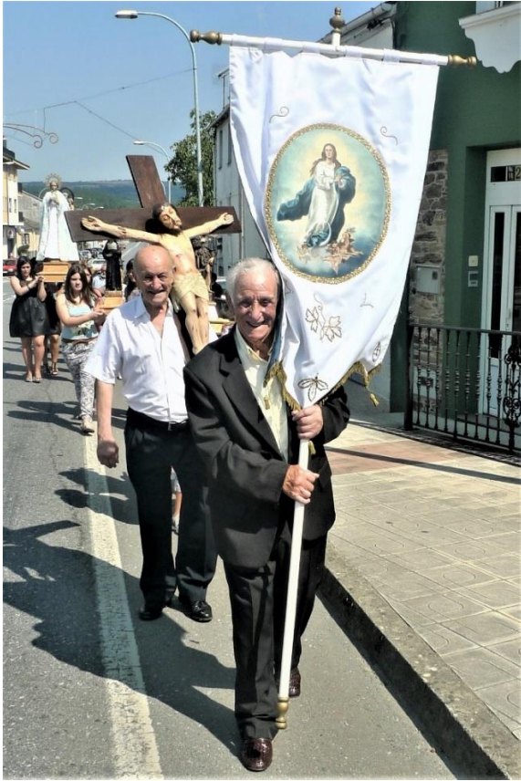
FOTO Nº 7. ESTANDARTE E CRUZ CO CRISTO