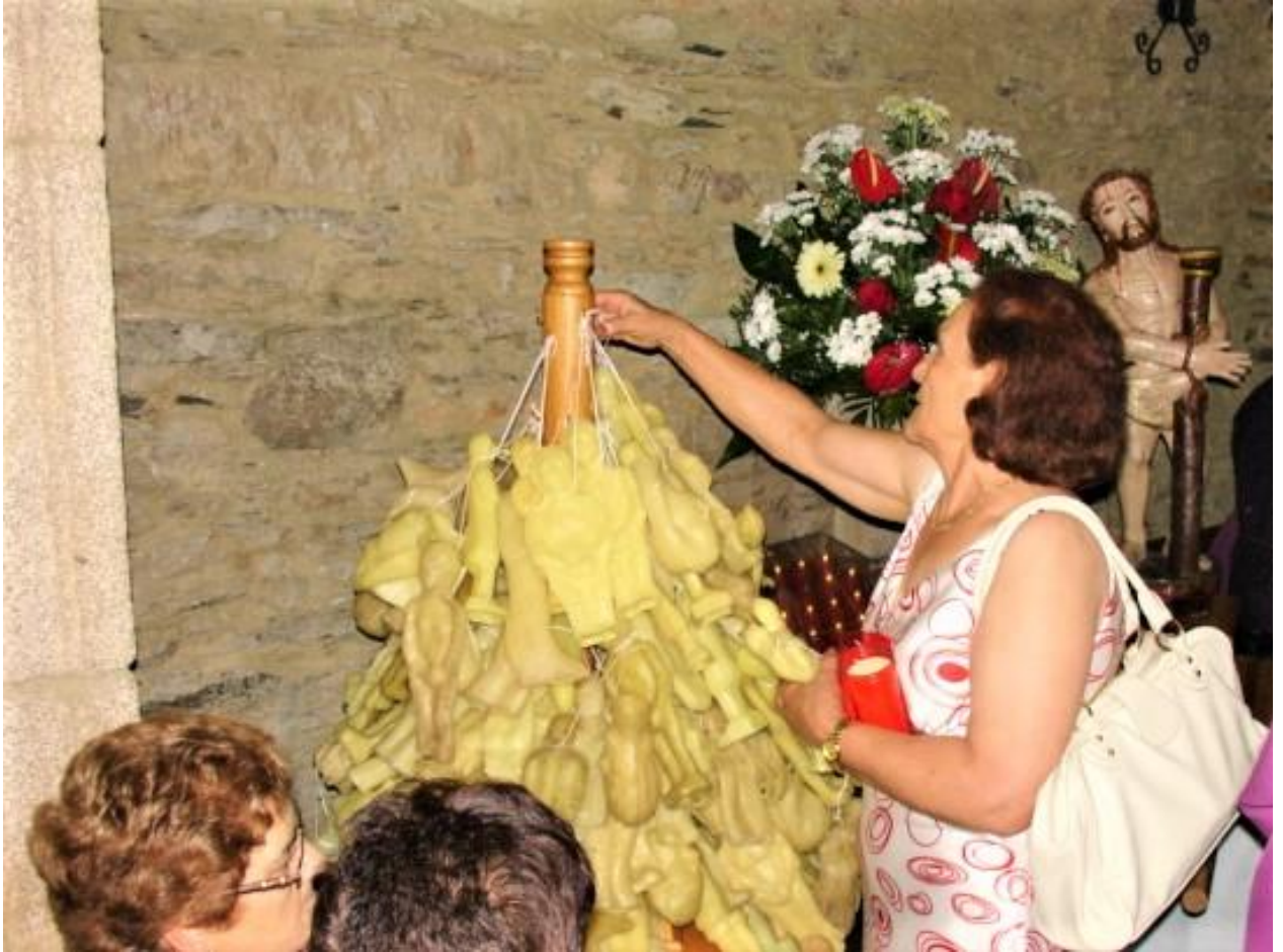
DEVOTA OFRECENDO UN EXVOTO DE CERA AO ECCE HOMO