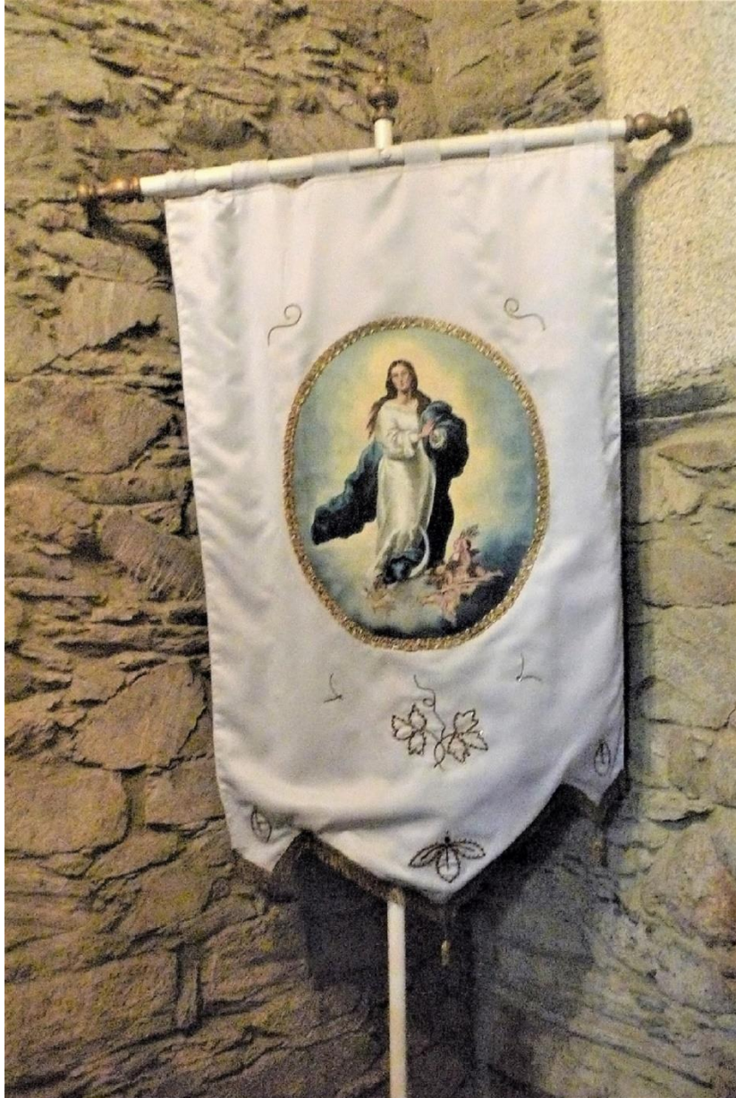
ESTANDARTE DA INMACULADA, QUE PRESIDE A PROCESIÓN.