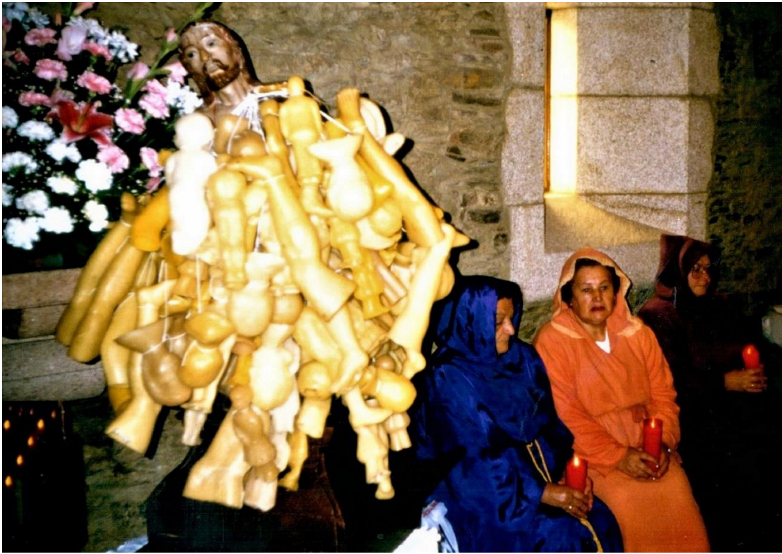
FOTO Nº 9. IMAXE DO ECCE HOMO CUBERTA DE EXVOTOS DE CERA DE CARÁCTER HUMANO.