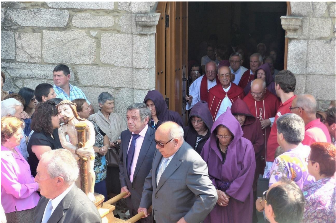
FOTO Nº6. SAÍDA DA PROCESIÓN. ECCE HOMO. DEVOTAS CON HÁBITO. CREGOS