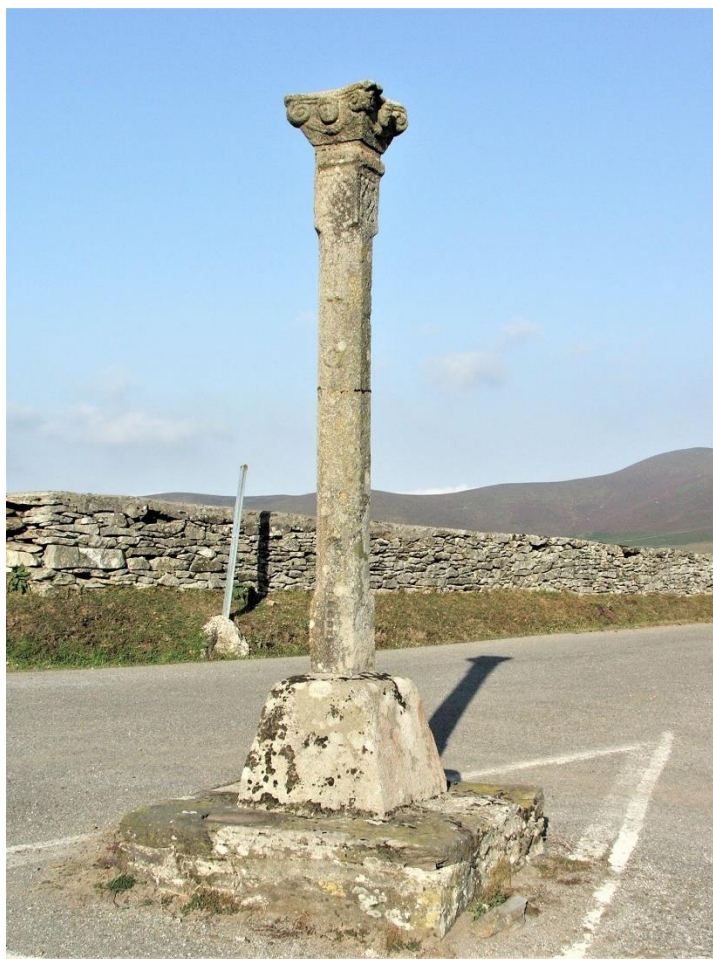
FOTO 7. CRUCEIRO DO ALTO DA GAÑIDOIRA

Unha plataforma formada por un chanzo de cachotería, que mostra unha forma paralelepípeda. Esta serve de sostén a unha base monolítica, granítica, e de forma tgroncopiramidal coas arestas