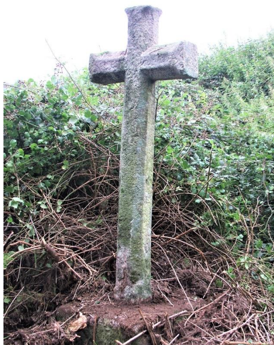
FOTO 14. CRUZ DO REGO DAS MULLERES

Unha base monolítica, granítica, e de forma paralelepípeda, Sobre esta prolongase unha cruz latina, monolítica, de considerables dimensión, que amosa unha sección cuadrangular nos extremos e oitavada no