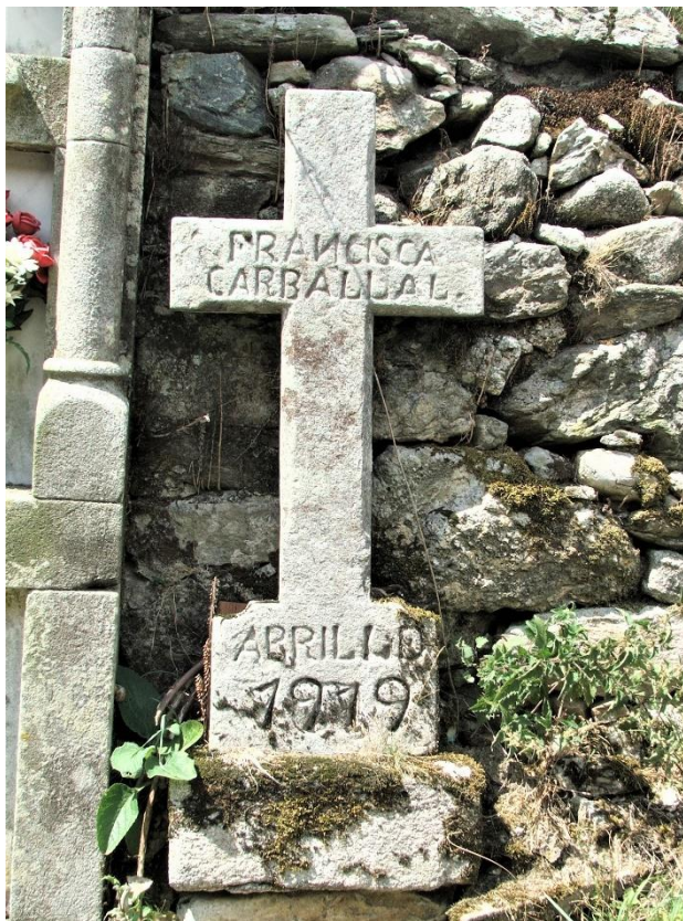
FOTO 13. CRUZ DO CEMITERIO

Unha plataforma granítica, de forma paralelepípeda, que serve de soporte a unha base tamén granítica e paralelepípeda, que amosa nos flancos