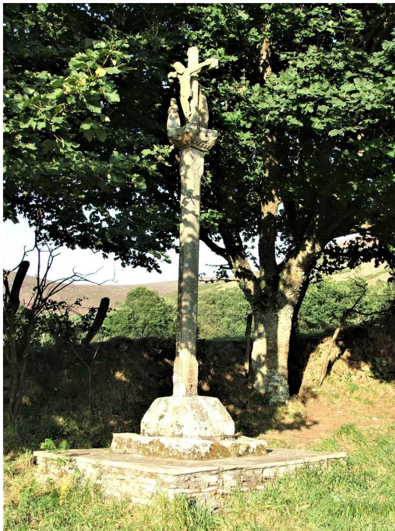
FOTO 9. CRUCEIRO DA CAPELA DE SAN ANTÓN

Unha plataforma formada por dous chanzos superpostos: o inferior, de cachotería e de forma paralelepípeda; e o superior, granítico e, tamén, de forma paralelepípeda xa irregular polos desgastes. Esta serve de sostén a unha base monolítica,