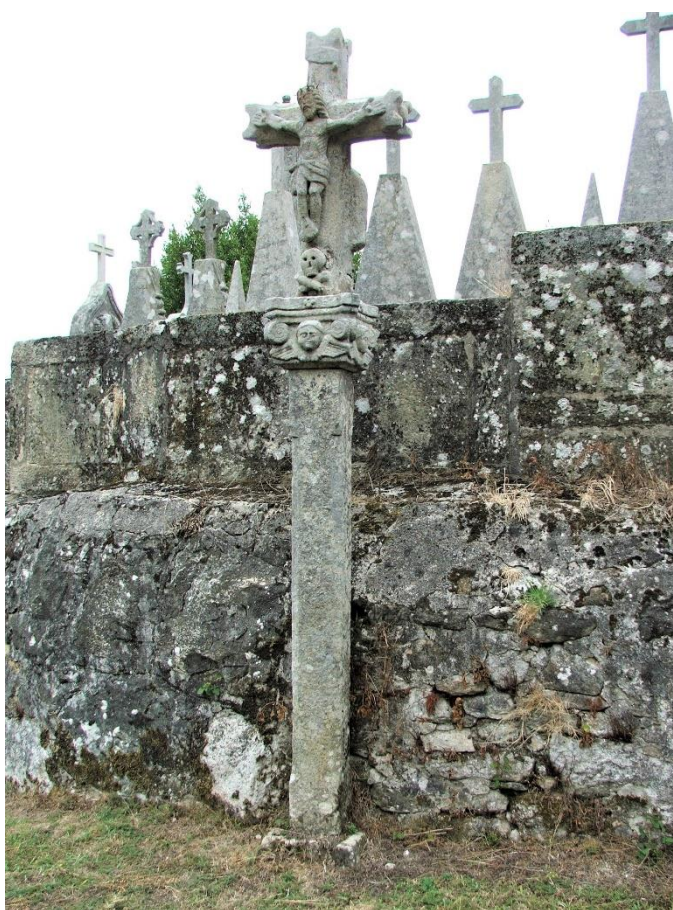
FOTO 11. CRUCEIRO DA IGREXA

Unha base monolítica, de forma paralelepípeda, parcialmente soterrada. Esta prolóngase nun fuste monolítico, de sección cuadrangular nos extremos e coas arestas achafranadas no resto. O fuste serve de soporte a un capitel de forma cúbica, decorado con