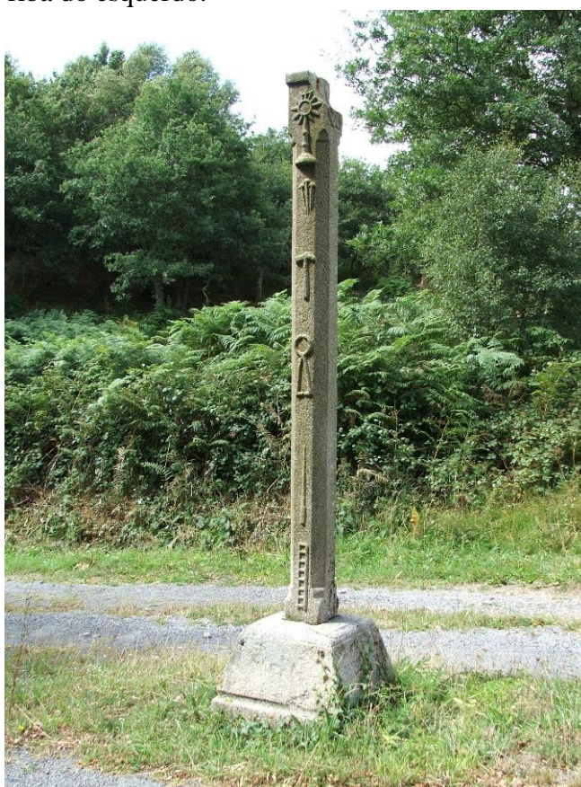
FOTO 2. CRUCEIRO DE SAMIL

Esta expresión artística, de propiedade dubidosa 11 está emprazada na pista que leva á igrexa parroquial. Posúe unha orientación Leste- W. Dende unha perspectiva artística está formada por unha serie de partes claramente diferenciadas e colocadas nunha orde ascendente do seguinte xeito: