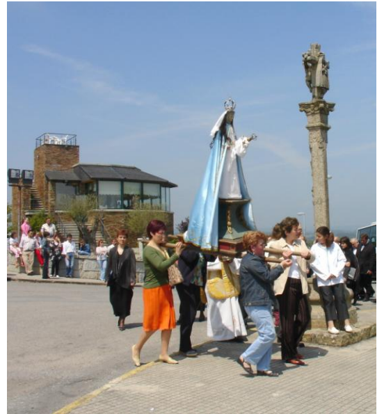
ADVOCACIÓN MARIANA DA VIRXE DO MONTE EN PROCESIÓN