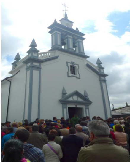
SANTUARIO DA VIRXE DOS MILAGRES (SAAVEDRA) (BEGONTE)