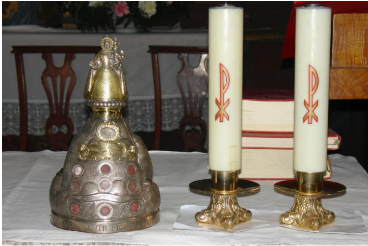
RELICARIO DA VIRXE DO MONTE (FEIRA DO MONTE) (COSPEITO)