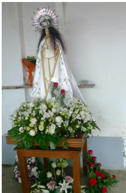
ADVOCACIÓN MARIANA DOS MILAGRES (SAAVEDRA) (BEGONTE)