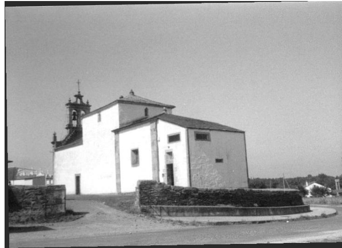
SANTUARIO DE ARCOS (OUTEIRO DE REI)