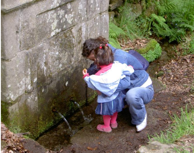
CATIVA BEBENDO DA AUGA DA FONTE DO SAN ALBERTE (SAN BREIXO) (GUITIRIZ)