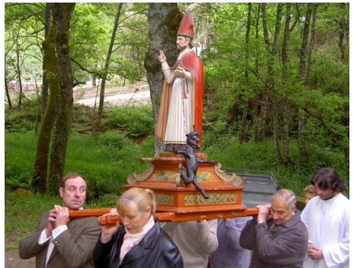
IMAXE DO SAN ALBREIX EN PROCESIÓN (SAN BREIXO) (GUITIRIZ).