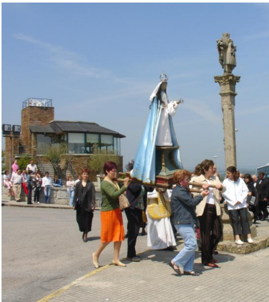
ADVOCACIÓN MARIANA DA VIRXE DO MONTE EN PROCESIÓN.