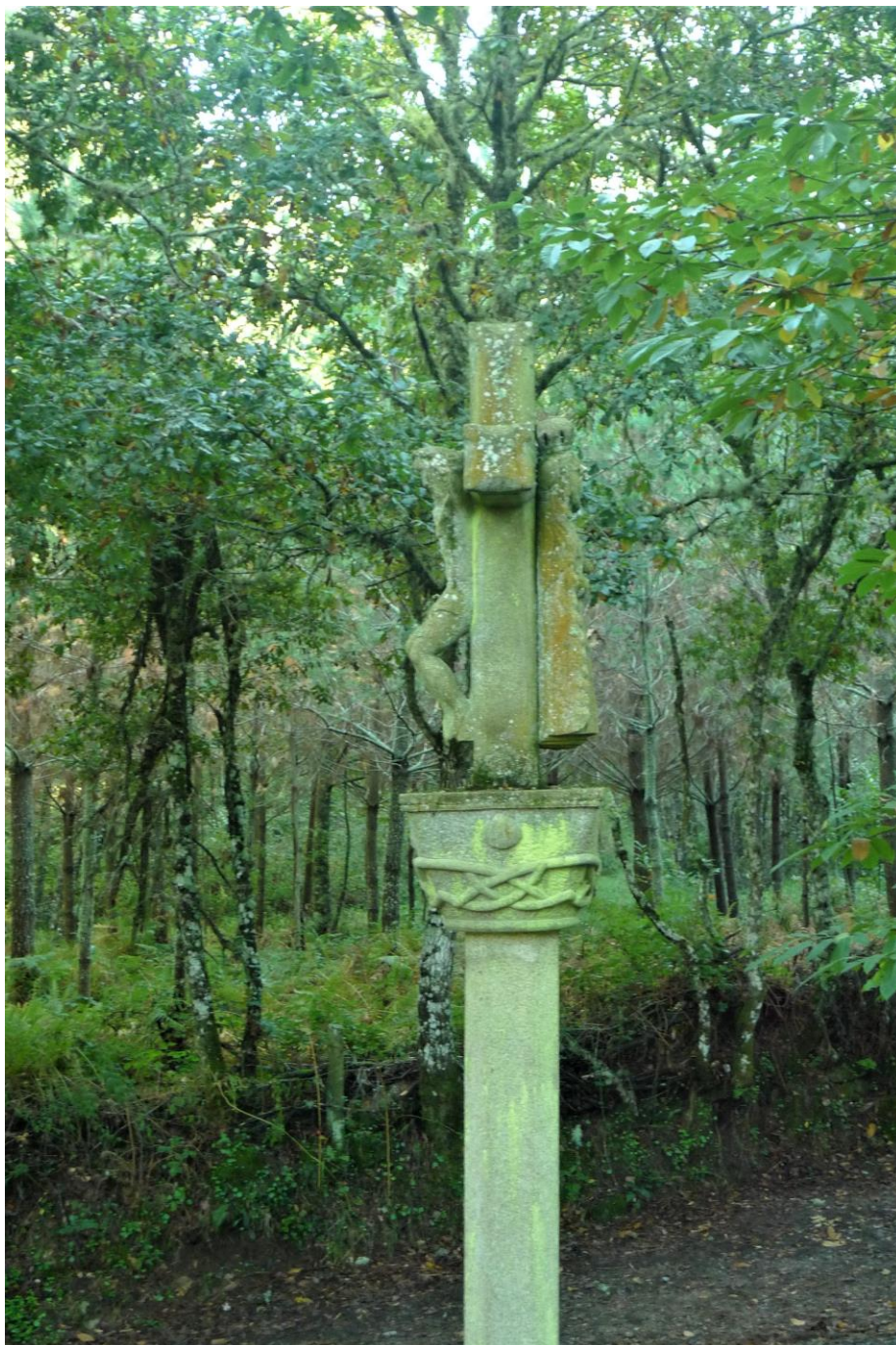
FOTO Nº 25. CRUCEIRO DO SAN ALBERTE. DETALLE.