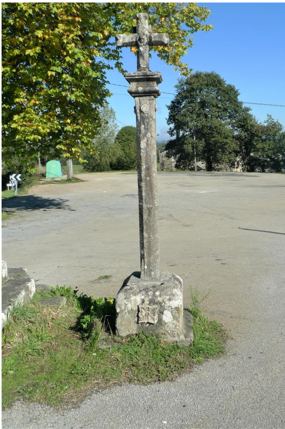
FOTO Nº 21. CALVARIO DOS VILARES. CRUCEIRO LATERAL ESQUERDO