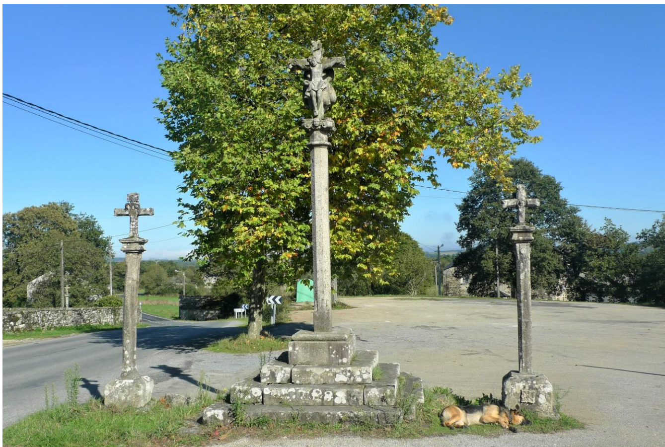
FOTO Nº 27. CALVARIO DOS VILARES