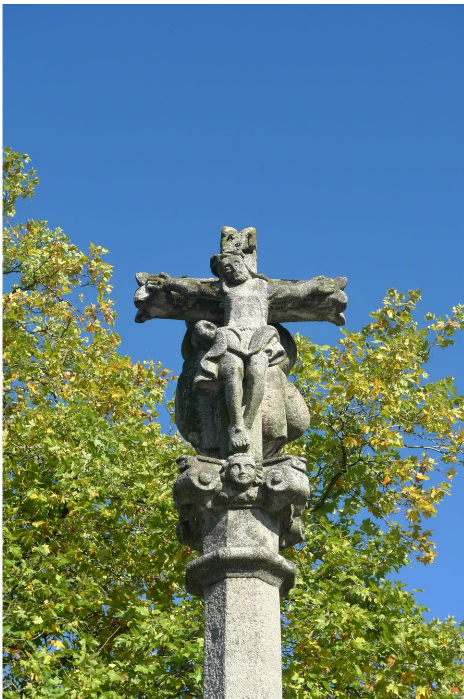
FOTO Nº 23. CALVARIO DOS VILARES. DETALLE CRUCEIRO CENTRAL