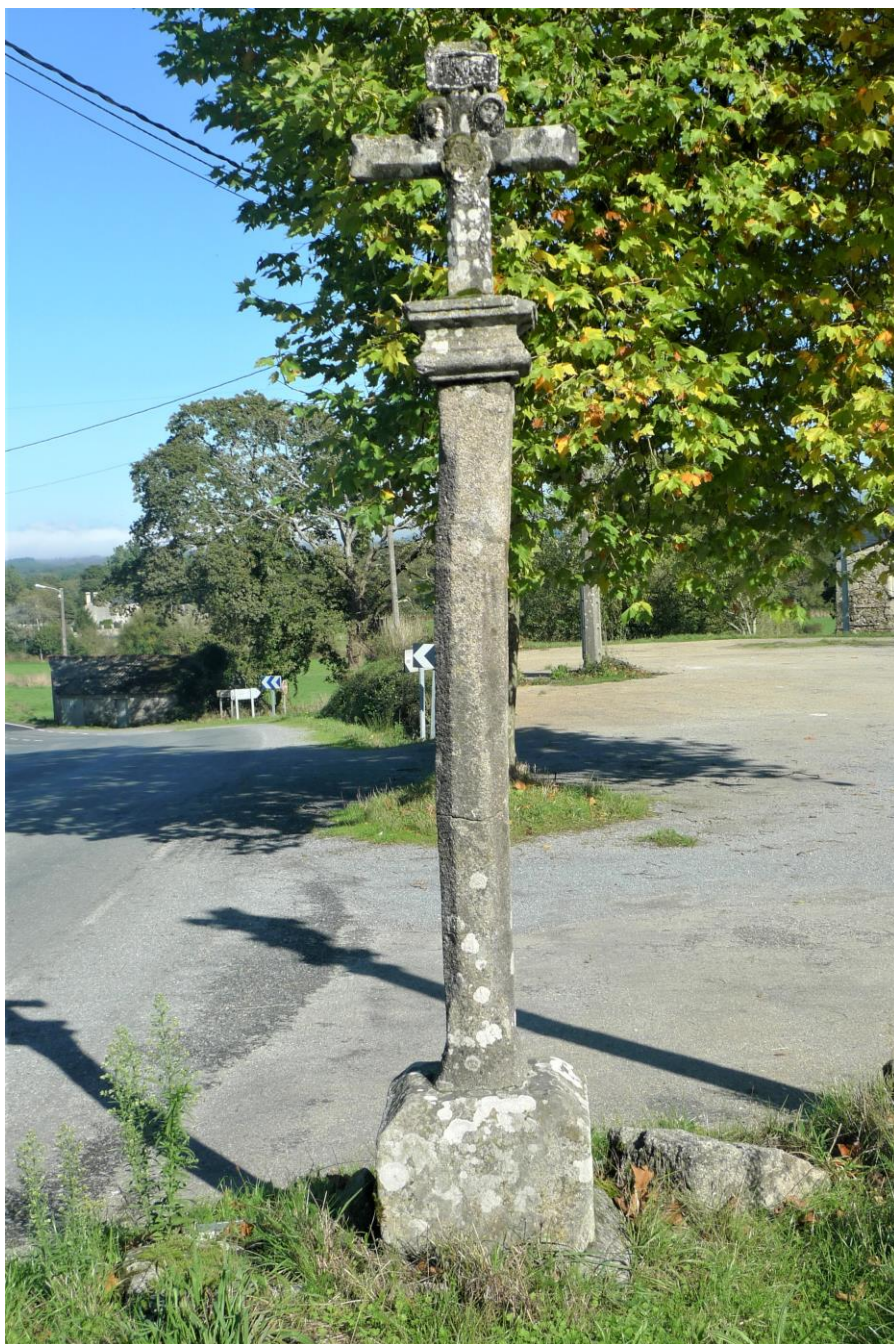
FOTO Nº 26. CALVARIO DOS VILARES. CRUCEIRO LATERAL DEREITO