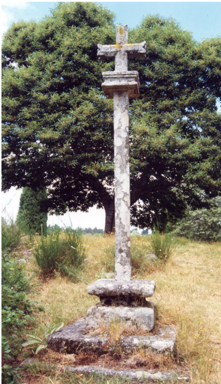
FOTO Nº 14. CRUCEIRO DE SAN SALVADOR DE PARGA