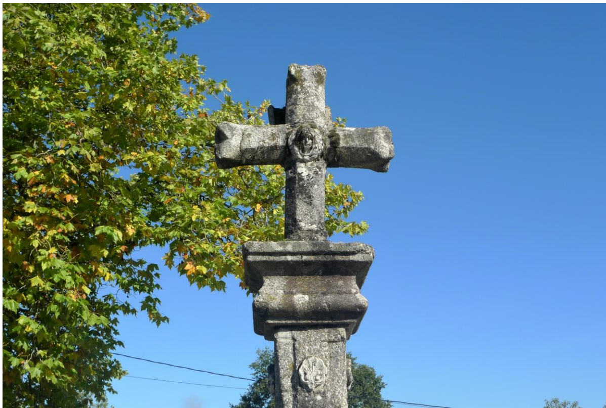
FOTO Nº 22. CALVARIO DOS VILARES. CRUCEIRO LATERAL ESQUERDO