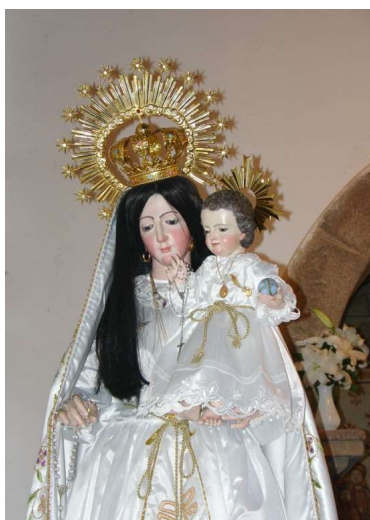
DETALLE DA VIRXE DA SAÚDE

“Los santuarios son lugares precisos de transformación de la energía divina para utilización humana y de transformación de la energía humana para propósitos divinos” 14