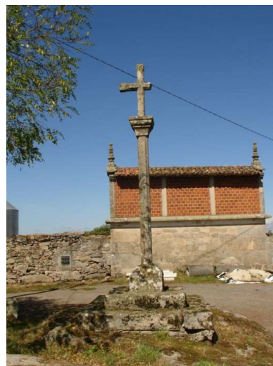
CRUCEIRO DE FRAMEÁN

É parte da cultura, dun modo de pensar e de vivir. Por elo, e para comprendela, se cadra sexa conveniente ter en conta o pasado, o que na actualidade lle rodea, os rasgos do lugar, o estilo das persoas, como viviron o cristianismo, que é o que herdaron dos séculos pasados, que é o que cada unha das xeracións recibiu e aportou. "Es popular lo que el pueblo crea. También, lo que recibe, asimila y hace propio". 3