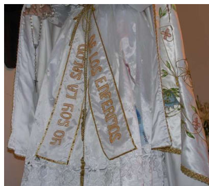
DETALLE DO MANTO DA VIRXE DA SAÚDE

Trátase dunha igrexa parroquial, de finais do século XII, que conserva a súa planta primitiva. Os seus muros son de sillería disposta en fiadas horizontais e a súa techumbre é de madeira a dúas augas cunha cuberta de tella. Consta dunha nave rectangular, cuxo alero exterior está decorado con canzoros lisos e xeométricos, e unha ábsida do mesmo trazado e con dimensións máis reducidas. Ambas as dúas estancias están iluminadas por unha pequena ventá de arco de medio punto, que se encontra no muro da cabeceira, e amosa un pavimento de laxas graníticas.