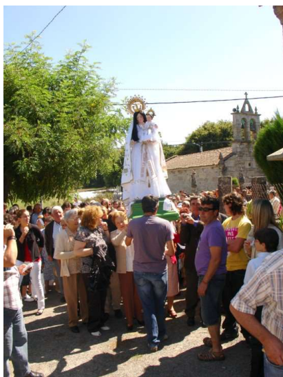
PABLO COMEZA COS RELEVOS

Trátase das remudas ou substitucións, que os devotos da advocación mariana van facendo das andas ao longo da procesión 36 . Os relevos comezaban no momento en que os distintos elementos da procesión cruzaban o adral da igrexa, separado do exterior por