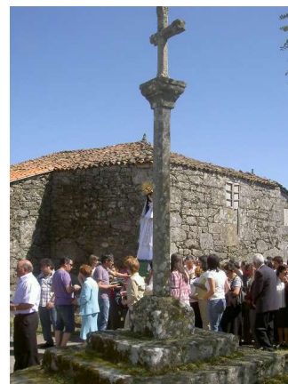
RITUAL PROCESIONAL AO REDOR DO CRUCEIRO

A mediados da década dos noventa do século pasado, o traxecto da procesión fíxose máis longo debido á cantidade de relevos existentes. E así a procesión, logo de saír do adral,