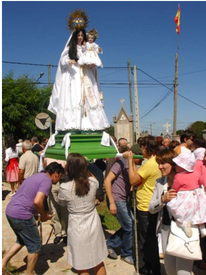
DEVOTOS PASANDO BAIXO AS ANDAS DA VIRXE.

culto do santuario e coa festa parroquial 52 . Á “poxa” acodían bastantes devotos, que mostraban interese por mercar algún produto en contacto coa imaxe sagrada do santuario. “ En muchos de los santuarios estas ofrendas en especie se venden en subasta pública...; los devotos muestran gran interés en comprarlas porque su contacto con los santos las ha convertido en reliquias ” 53 .