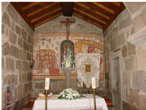
ALTAR CENTRAL DO SANTUARIO MARIANO

O principal motivo da votación era por motivos laborais, xa que un bo número de veciños da comunidade parroquial non traballaba os sábados. Pois ben, o resultado da votación foi favorable ao cambio. Sen embargo cómpre dicir que, segundo os veciños de máis idade da parroquia, o lúns era