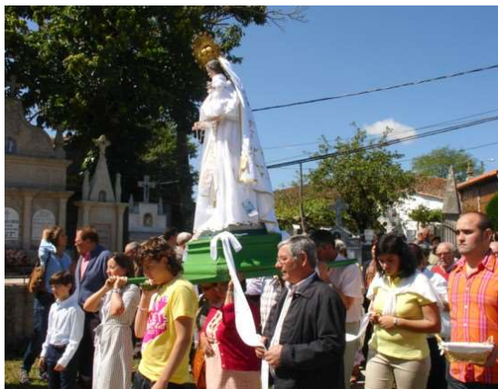
DEVOTOS LEVANDO AS CINTAS DA VIRXE