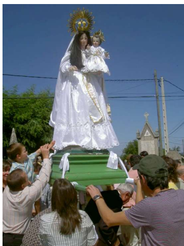
RITUAL DE CONTACTO

Antano, logo da misa solemne 34 , saía a procesión que transcorría polo lado descuberto da chousa en dirección ao recinto sagrado, onde daba unha volta ao seu perímetro para introducirse despois no seu interior. A disposición dos seus elementos era o seguinte: Ao comezo ía un estandarte pertencente a “ Casa dos Regueira ”, que era portado case sempre por un membro desta familia. Seguíalle a cruz parroquial levada por un fregués da parroquia. Logo, o patrón da comunidade parroquial de Frameán, San Pedro, portado nas súas andas por catro fregueses da freguesía susodita. A continuación, a advocación mariana da Saúde, levada tamén nas súas andas por devotos de diferentes parroquias. Como remate da procesión, viñan os cregos concelebrantes e os devotos, colocados sen distinción de idade e sexo 35 . Co paso dos anos a procesión trocou de itinerario, e así ao saír do adro da igrexa ía ó carón das “ Casas de Plácido, Xaquín, e Cruceiro ”, para rematar na igrexa parroquial.