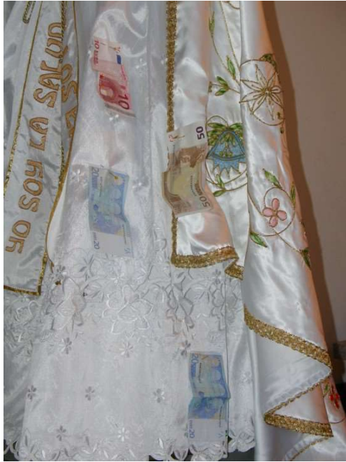
O MANTO E O VESTIDO DA VIRXE CON CARTOS