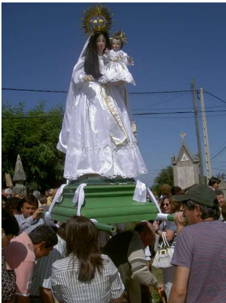
DEVOTOS PASANDO BAIXO AS ANDAS DA VIRXE.

Ademais, a dimensión sacra transmítese ao exterior, dun xeito directo, por medio da procesión, Así, a imaxe, que sae na mesma, santifica o espacio que percorre proporcionando unha enerxía positiva a tódolos seres, que se encontran no mesmo. Respecto á disposición da procesión Álvarez Gastón distingue unha serie de trazos 56 : trátase de manifestacións máis multitudinarias non só polos participantes activos senón tamen polos numerosos espectadores. No interior da comunidade local é algo que chega vitalmente aos fregueses. Ademais, neste ritual é mester reparar na imaxe, no xeito de levala, nos fieis que toman parte e no que mira, así como no espírito da celebración reflectado nos rezos, e mesmo no silencio.