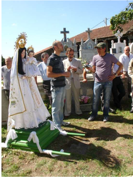
POXA DAS ANDAS E CINTAS