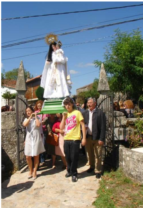
A PROCESIÓN RETORNA AO ADRAL