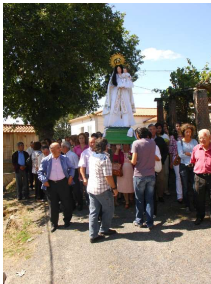
DEVOTOS BAIXO AS ANDAS DA VIRXE

1.4. C.P.E. ( CINTA POSTERIOR ESQUERDA): 70 EUROS.