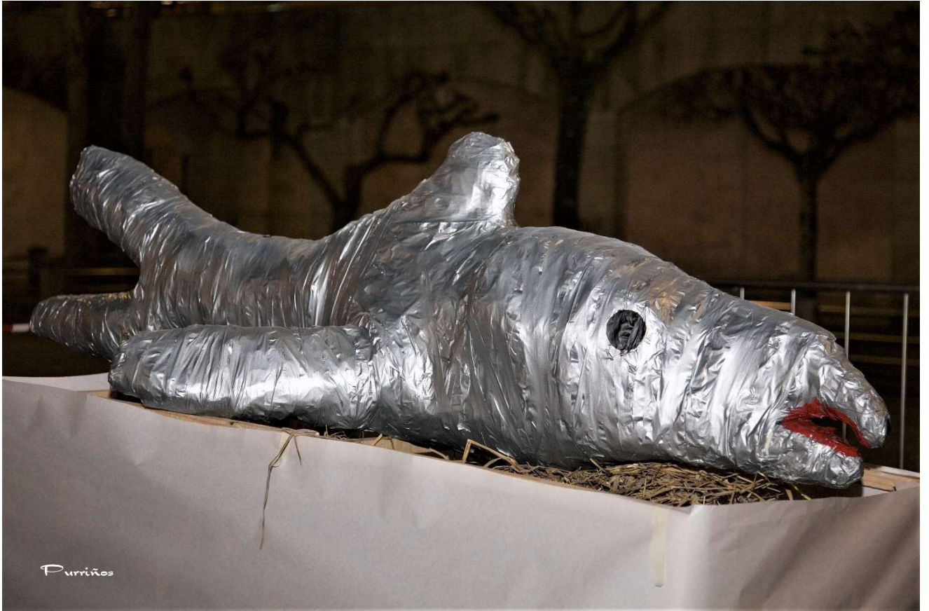
FOTO 13. BONECO REPRESENTATIVO DA SARDIÑA