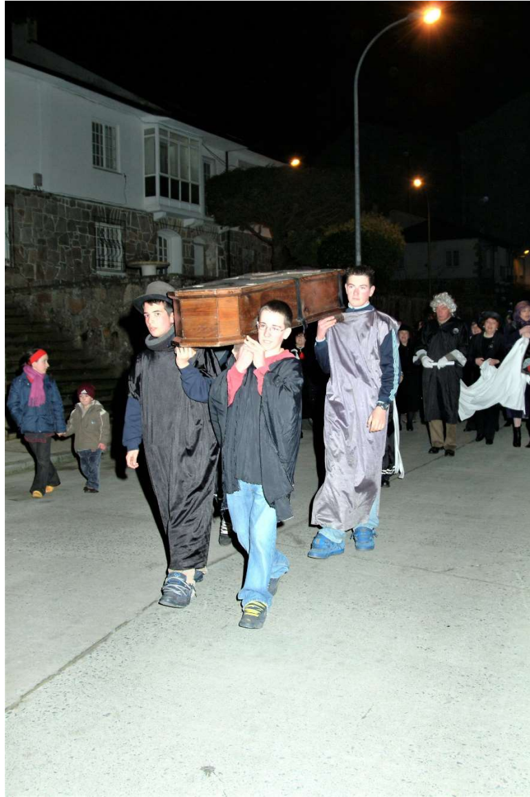
FOTO Nº 4. CATRO RAPACES LEVANDO O CADALEITO COA SARDIÑA NO SEU INTERIOR