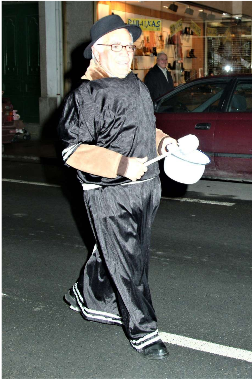
FOTO Nº 6. PERSOA ENCARGADA DE VOTAR AUGA BENDITA DUN OURIÑAL