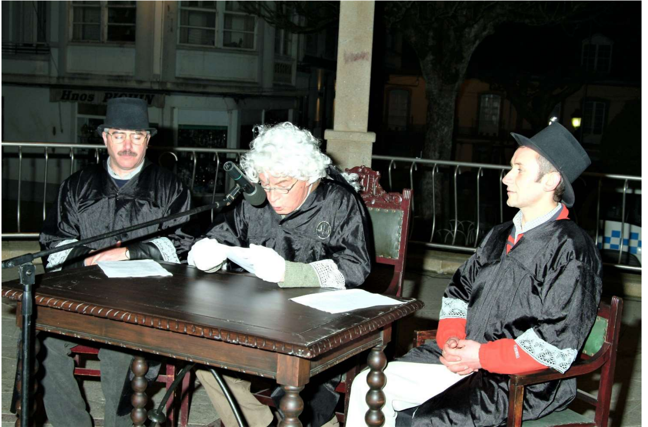
FOTO 12. O CONSELLO XUDICIAL ARGUMENTA SOBRE QUEIMAR OU NON A SARDIÑA