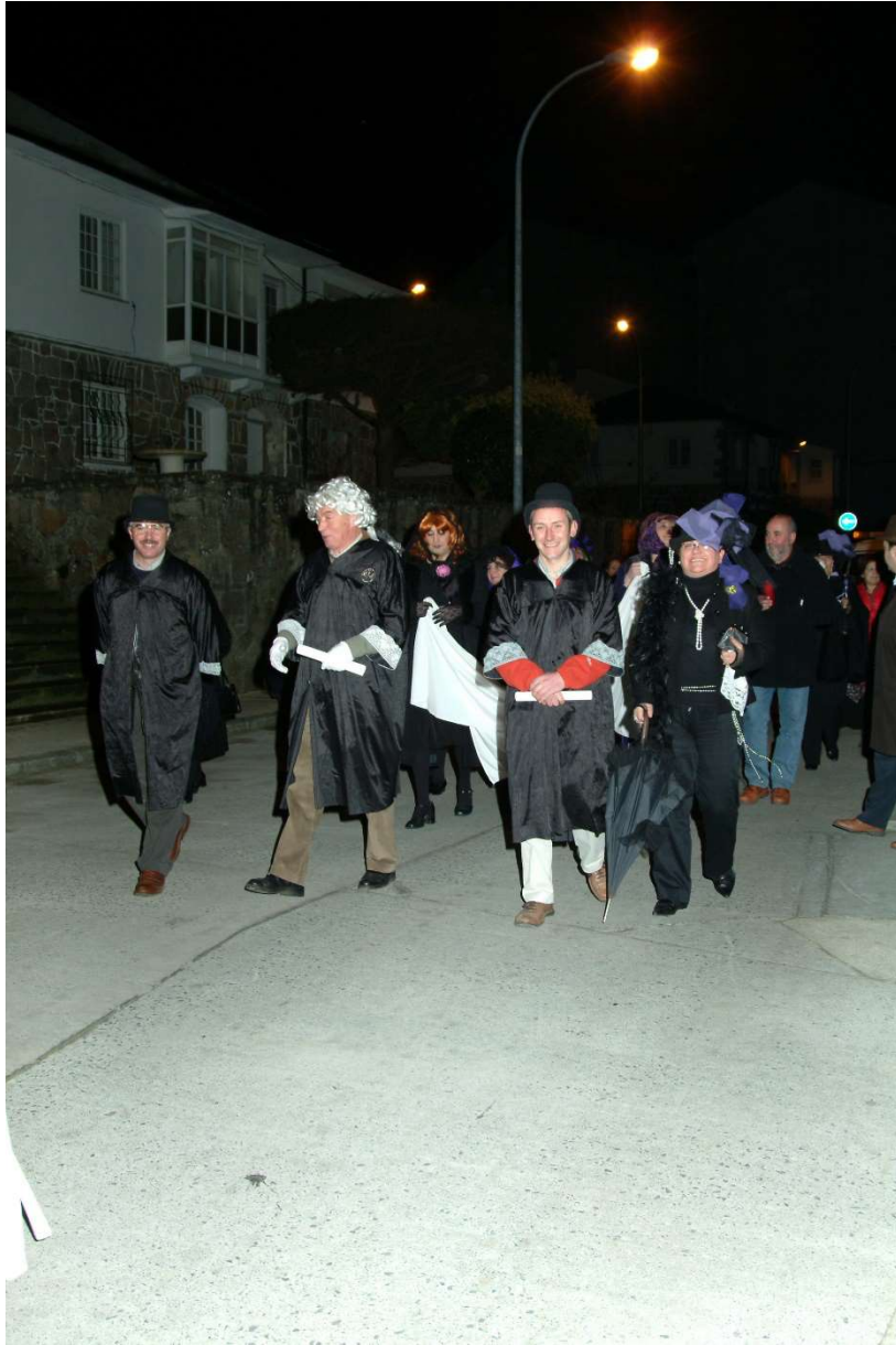
FOTO Nº 5. O CONSELLO XUDICIAL FORMADO POR UN XUIZ, FISCAL E AVOGADO DEFENSOR.