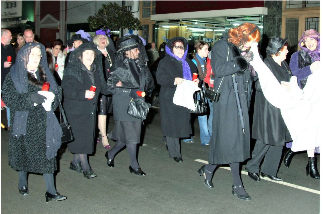
FOTO Nº 7. AS CHORONAS