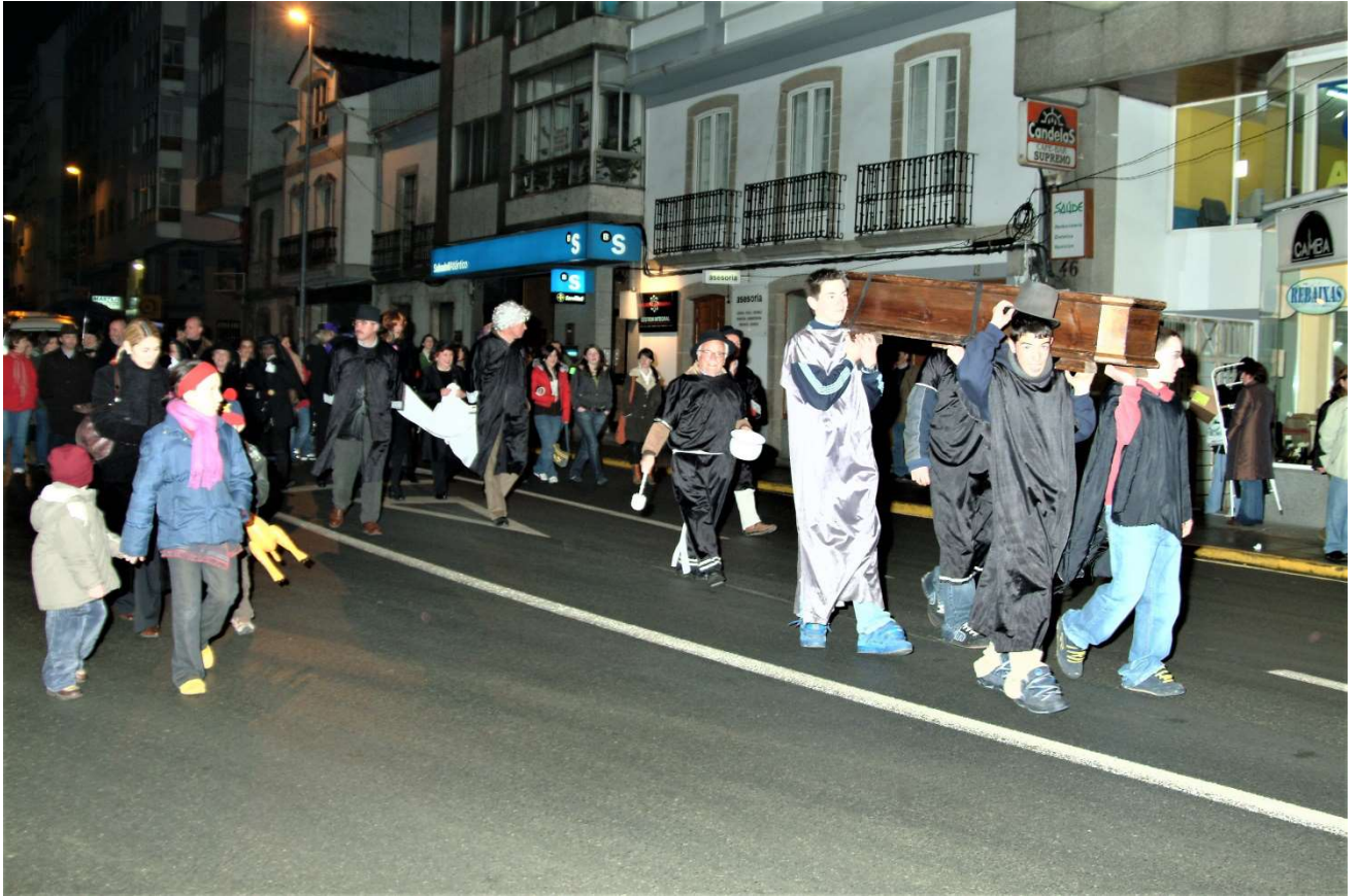
FOTO Nº 8. O CORTEXO FÚNEBRE POLA RÚA DA PRAVIA.