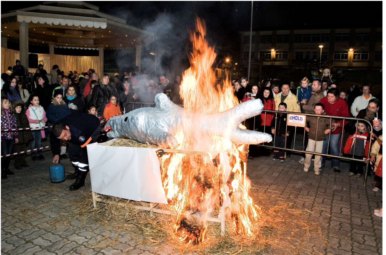
FOTO 14. QUEIMA DA SARDIÑA