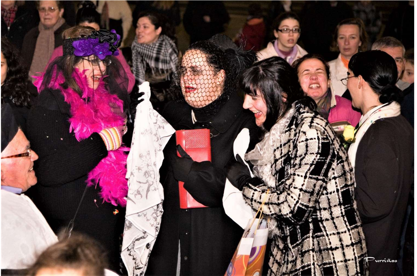
FOTO Nº 10. DETALLE DAS CHORONAS.