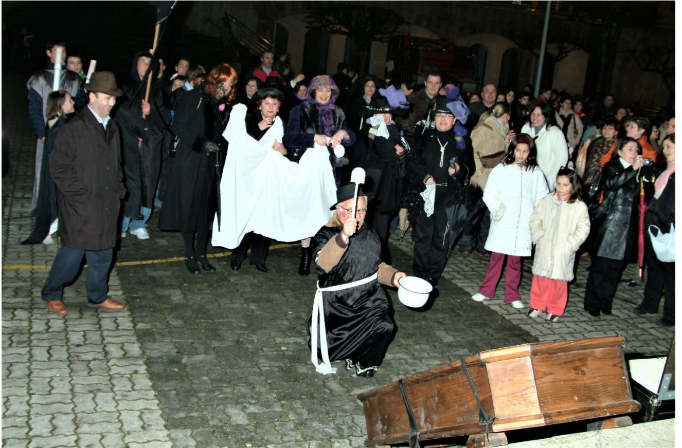
FOTO Nº 11. UNHA PERSOA, QUE FAI DE ACÓLITO, FAI QUE BOTA AUGA BENDITA SOBRE O CADALEITO.