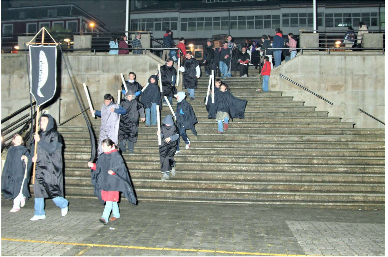
FOTO Nº 2. INICIO DO CORTEXO FÚNEBRE BAIXANDO AS ESCALEIRAS DENDE O AXUNTAMENTO.