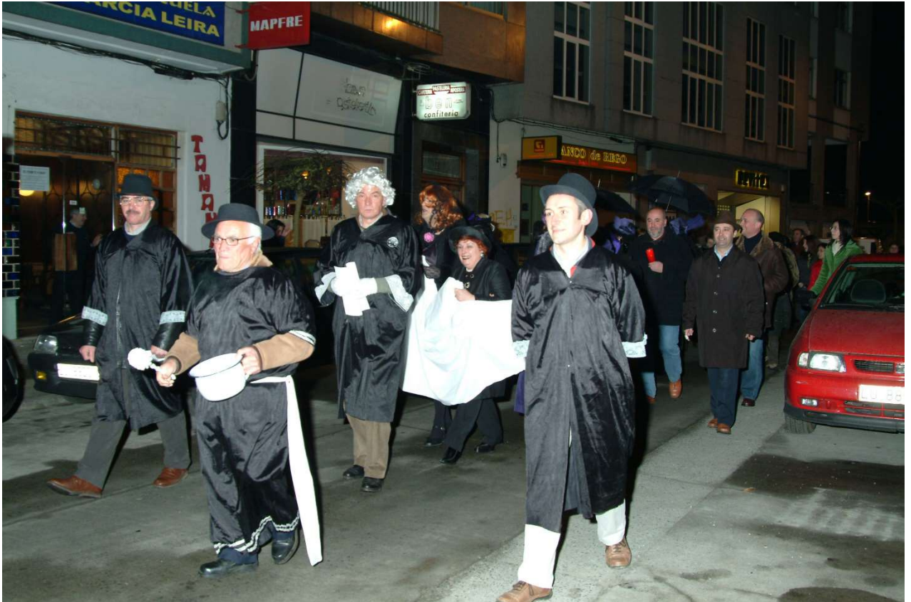
FOTO Nº 9. DETALLE DO ENTERRO DA SARDIÑA