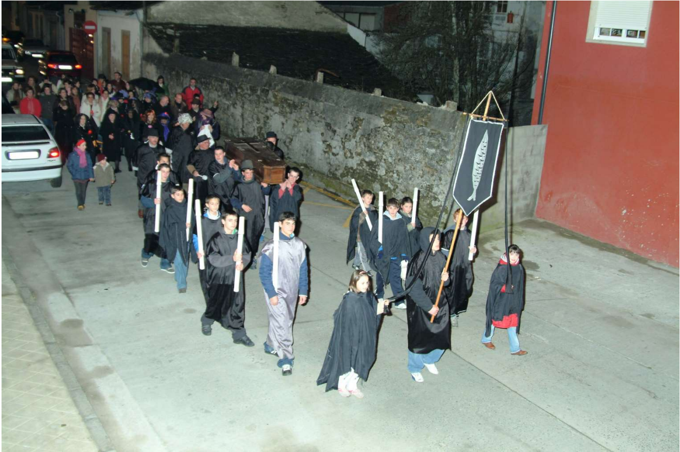
FOTO Nº 3. VISTA XERAL DO CORTEXO FÚNEBRE PERCORRENDO UNHA DAS RÚAS DA VILA.