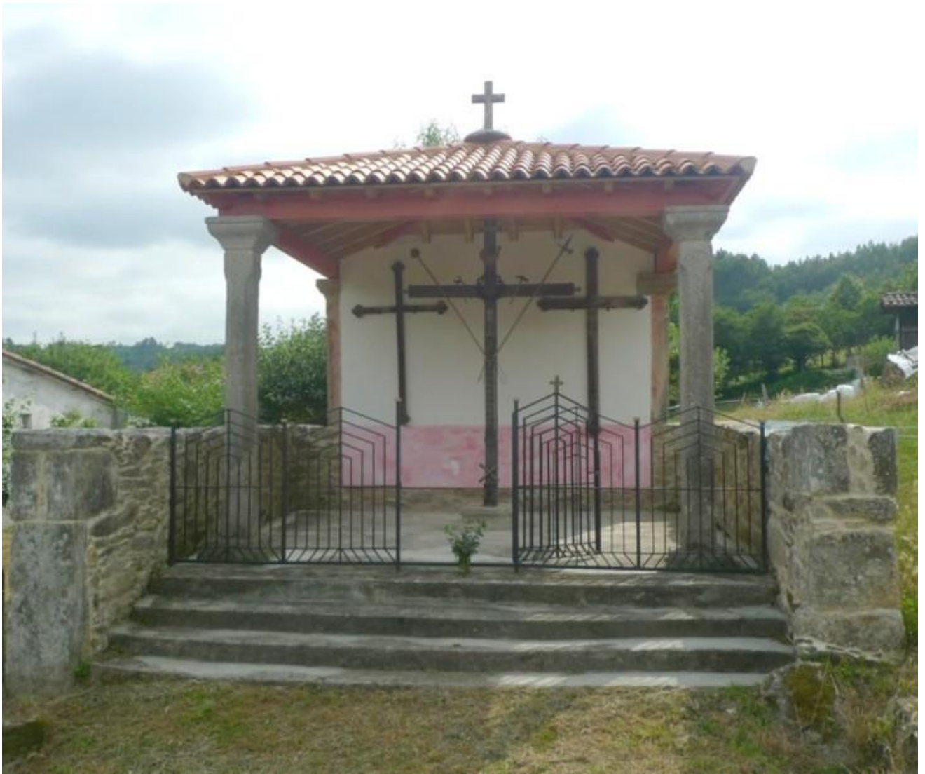
FOTO Nº1. ORATORIO DA SANTA CRUZ. PARROQUIA DE SAN BREIXO