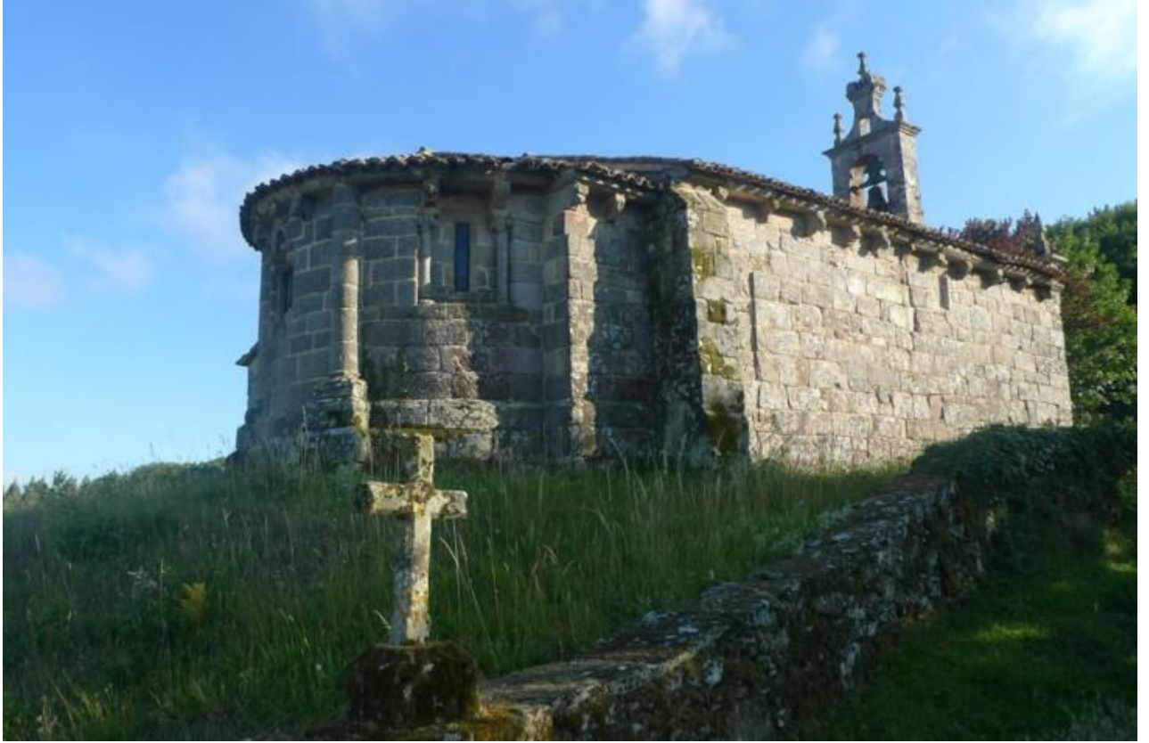
FOTO Nº 21. RESTOS DO VIACRUCIS DE STA. MARÍA DE MARZÁ.