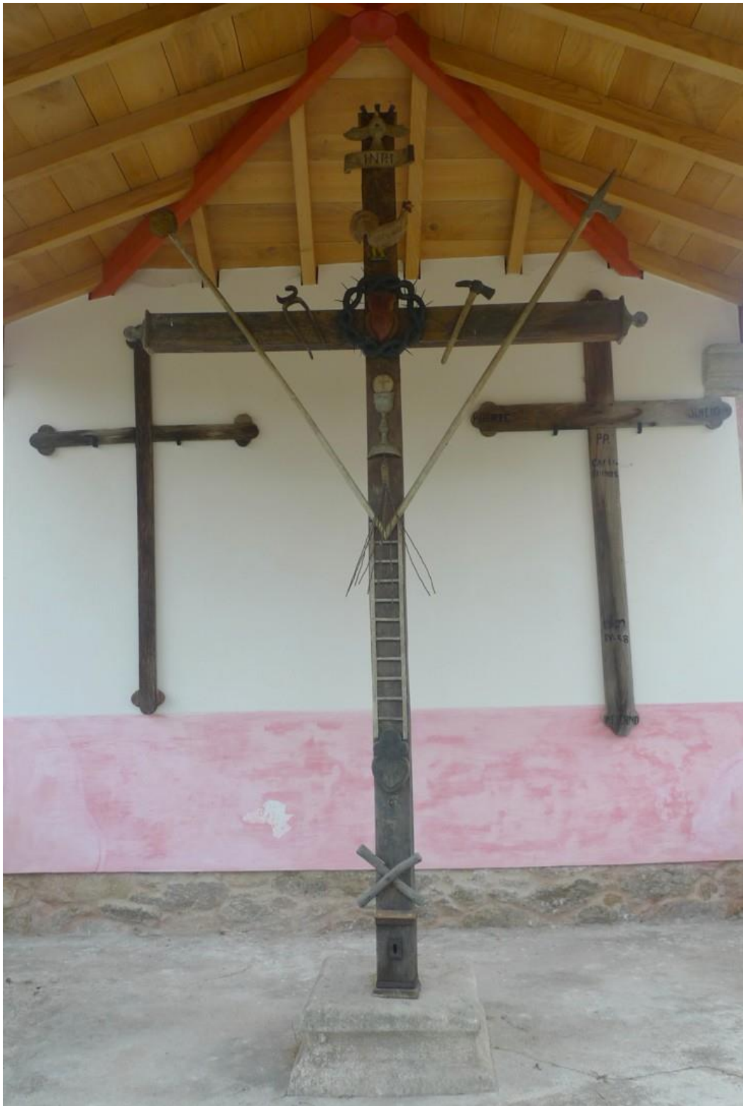
FOTO Nº 2. ORATORIO DA SANTA CRUZ. PARROQUIA DE SAN BREIXO