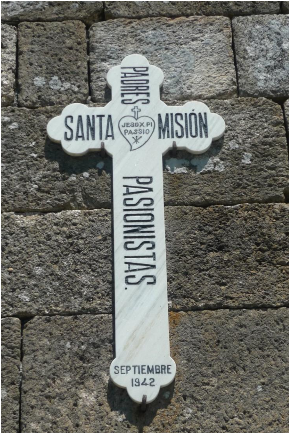
FOTO Nº 14. CRUZ MISIONAL DE SAN MAMEDE DO CARBALLAL