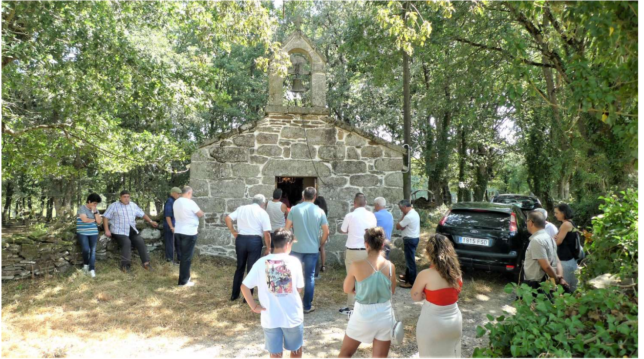
FOTO Nº 1. ALGÚNS DEVOTOS OEN A MISA SOLEMNE DENDE FORA DA CAPELA POR FALTA DE ESPACIO.