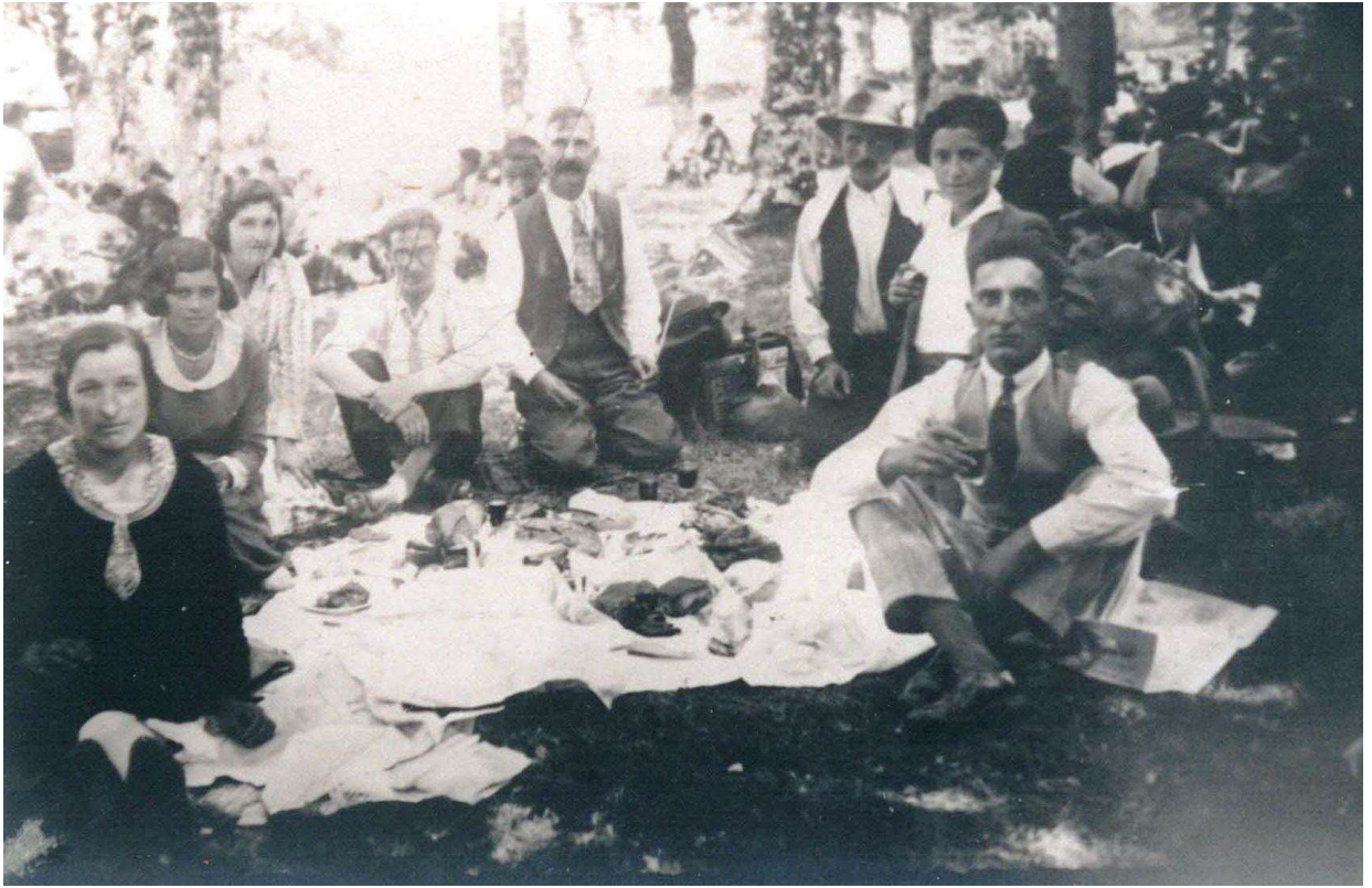
FOTO Nº 3. ANTIGO XANTAR CAMPESTRE