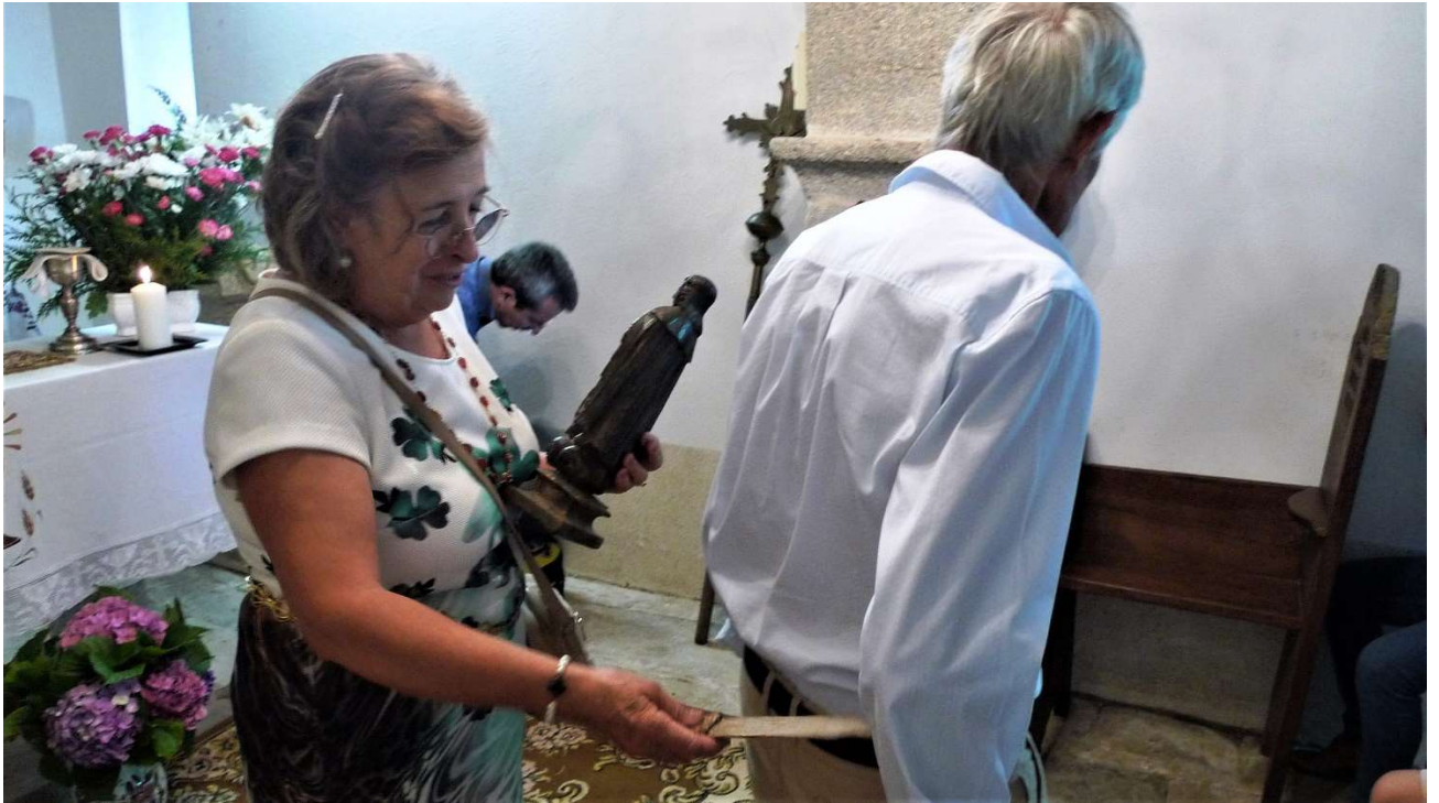
FOTO Nº 13. A ENCARGADA DE FACER O RITUAL PASA O COITELO POLAS COSTAS.