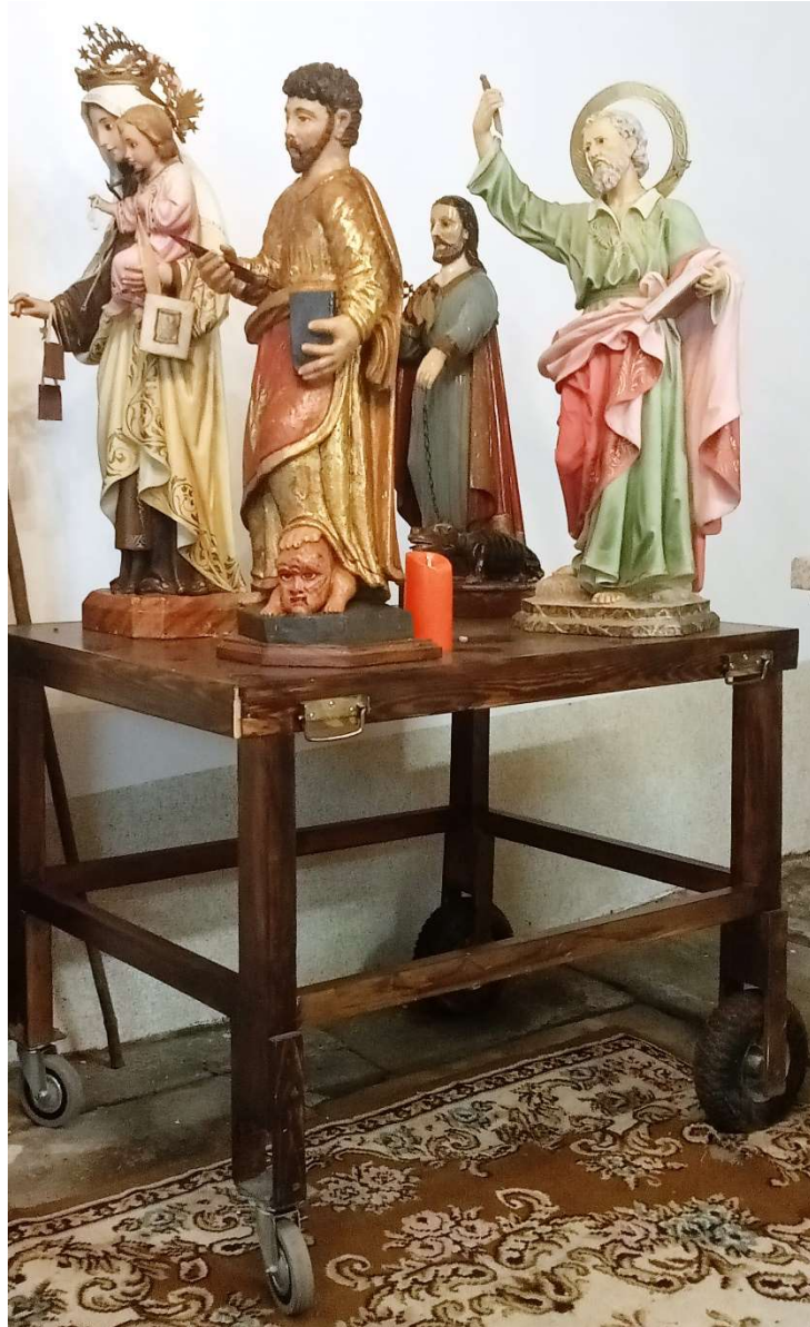
FOTO Nº 2. AS TRES IMAXES DO SAN BERTO E A IMAXE MARIANA DO CARMEN