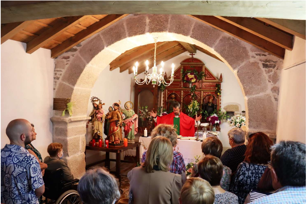
FOTO Nº 4. RITUAL DA MISA CO INTERIOR DA CAPELA ATEIGADO DE DEVOTOS