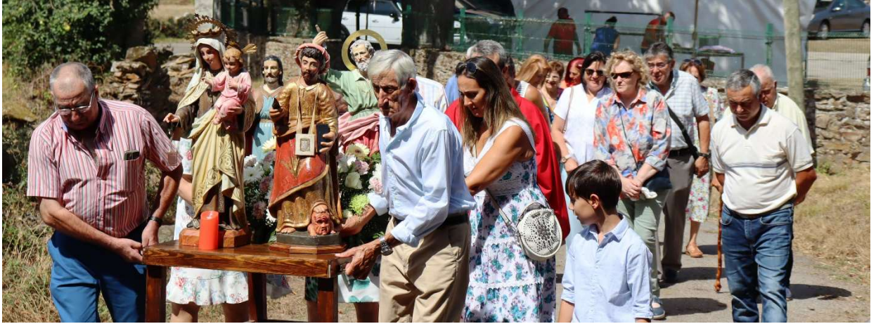
FOTO Nº 10. RITUAL DA PROCESIÓN.