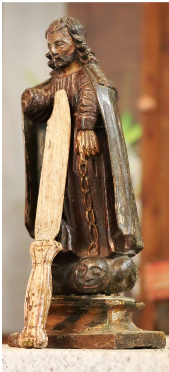
FOTO Nº 7. UNHA DAS IMAXES DO SAN BARTOLOMEU CUN DOS SEUS SIMBOLOS: O COITELO.