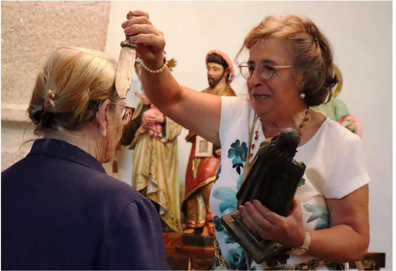
FOTO Nº 9. A ENCARGADA DE FACER O RITUAL PASA O COITELO POLA CABEZA DA DEVOTA.