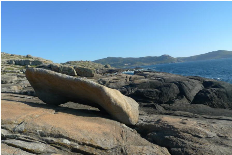
O PEDREGAL DE MUXÍA. EN PRIMEIRO TERMO “A PEDRA DOS CADRÍS”.