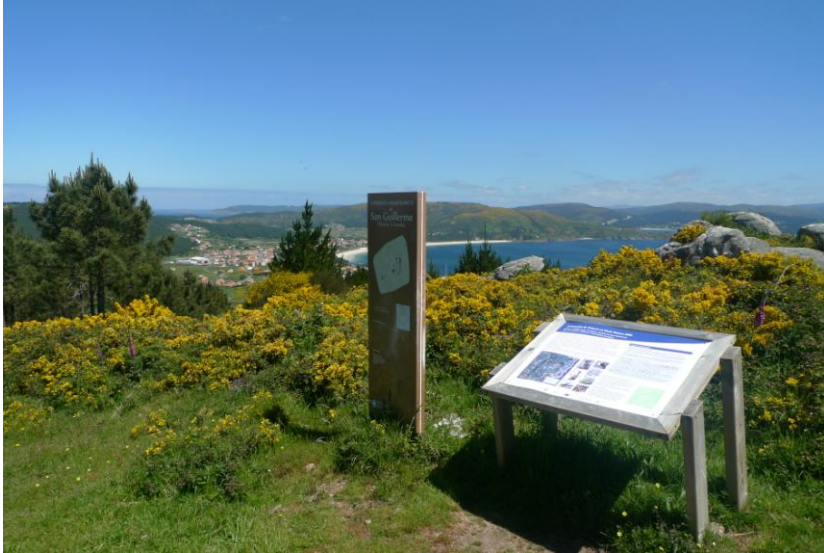
PANEL EXPLICATIVO DA ERMIDA DE SAN GUILLERME