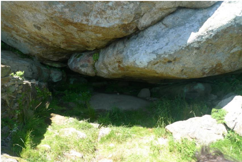
OQUEDADE DO RECINTO SAGRADO