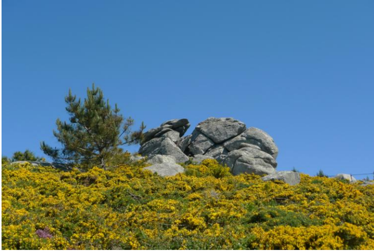
ROCHAS DO MONTE FACHO