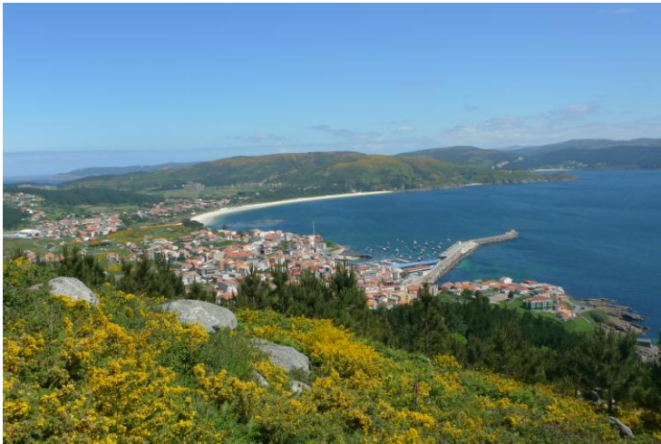
A VILA DE FISTERRA VISTA DESDE O MONTE DE SAN GUILLERME