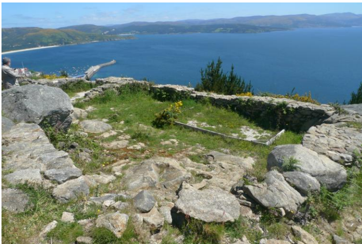
RESTOS DA CAPELA DE SAN GUILLERME