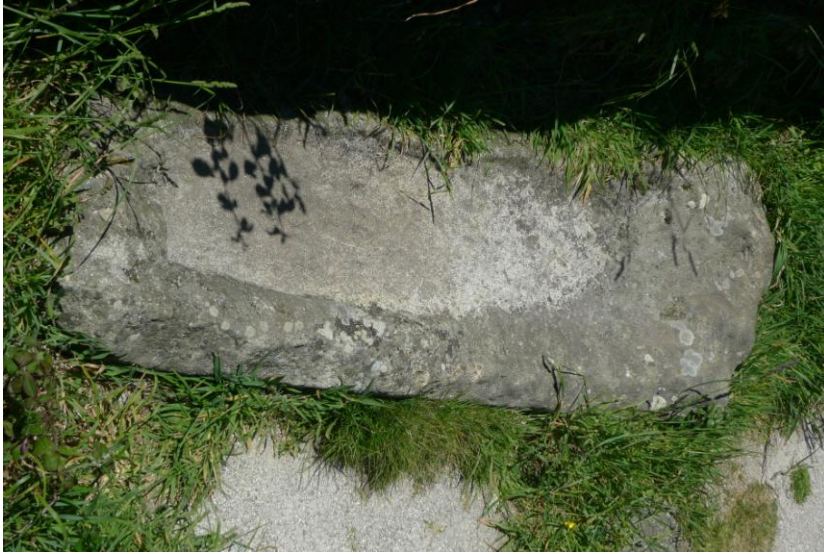
SARTEGO DE SAN GUILLERME OU “CAMA DO SANTO”