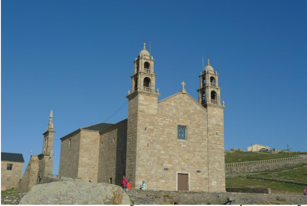
O SANTUARIO DA NOSA SEÑORA DA BARCA (MUXÍA) (A CORUÑA)