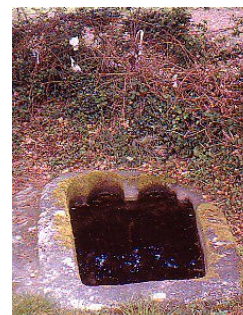
Ritual da "pía da auga"