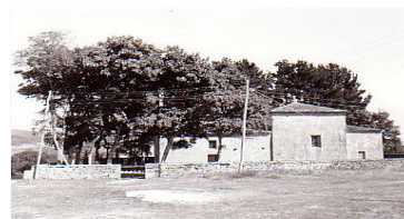
Vista exterior do santuario de S. Matías

Segundo González Reboledo, este santuario "es una obra que en su fábrica actual aparenta ser de los siglos XVIII y XIX. Aparejo de sillar. Frontis con puerta adintelada y espadaña de dos vanos. Nave rectangular, capilla mayor con arco triunfal de medio punto y sacristía adosada. Hay tres retablos. El mayor del siglo XIX, con imagen de S.Matías, de vestir, y S. Lorenzo. Retablo derecho, barroco popular, con columnas salomónicas, e imáxenes de S.Amaro y crucifijo en el cuerpo superior.