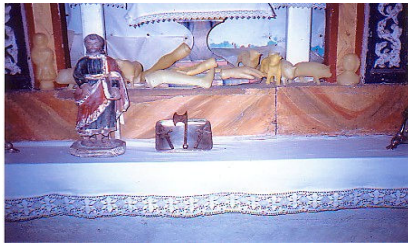
Imaxe pequena do santo, exvotos de cera e pequena machada metálica.

Este ritual, que se deixou de usar hai máis ou menos uns quince anos, consistía en que cando un neno tardaba máis tempo do normal en andar, os seus familiares máis achegados levábano á capela do S.Matías cos dous pés atados por un fío de lá. No interior da capela, o crego cortáballe ó cativo o fío de lá cunha pequena machada metálica, para que se soltase o antes posible a andar. "Decían que eran los niños que nacían con los pies cruzados; entonces les ataban los pies con un hilo,y los llevaban al