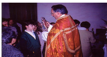
Ritual de "poñer o santo"

Tocante ós rituais de carácter individual distinguimos preferentemente tres: O RITUAL DE " POÑER O SANTO, O RITUAL DA " PÍA DE AGUA E O RITUAL DE " CORTAR A SOLTA".