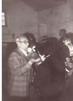
Ritual de poñer o santo

"Por tu corazón bendito santo del rostro moreno de todo infernal veneno líbranos santo bendito".