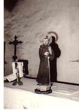
Imaxe para “poñer o santo”

Os devotos levan a cabo unha serie de rituais no santuario no intre en que fan a petición ou unha vez conseguida a mesma.